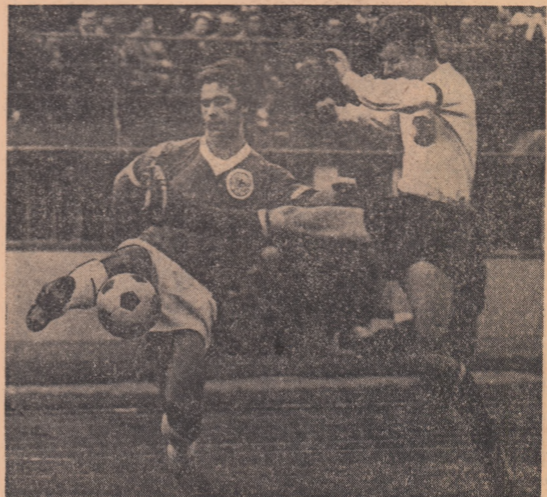
Iată-l pe „tunarul” Gerd Müller (stînga) în acțiune