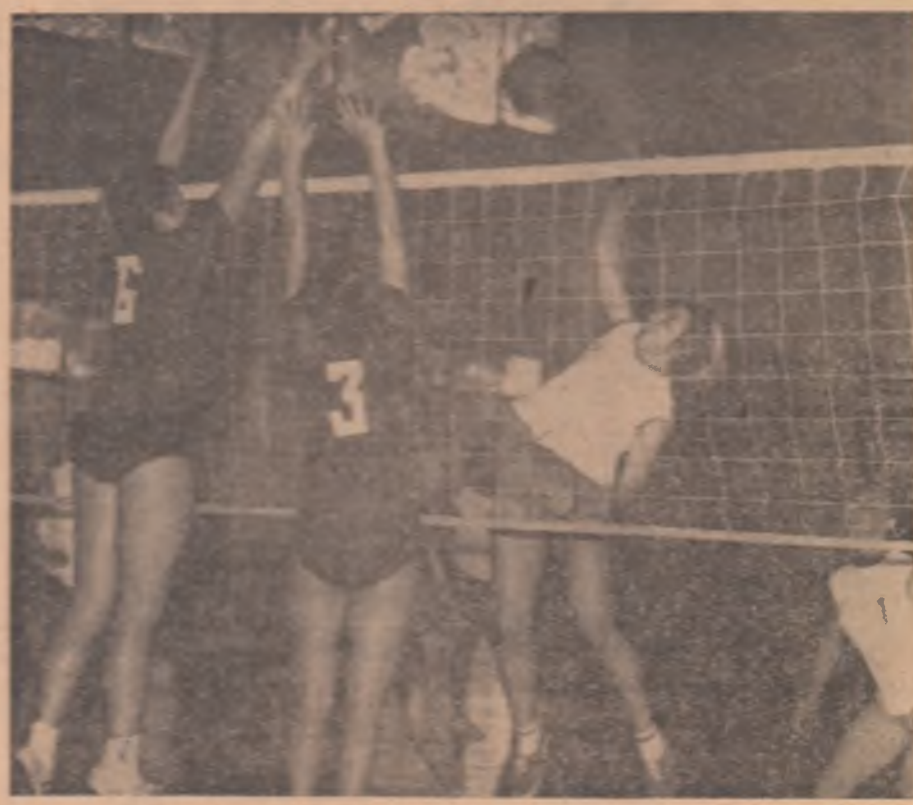
Fază din meciul feminin Progresul București — Universitatea Timișoara.

...ii centrale și organizații obștești, generali, ziaristi. Erau de față B. D. Goswami, însărcinată cu afaceri ad-interim al Indiei în Republica Socialistă România, și membri ai ambasadei Indiei, șefii misiunilor diplomatice acreditate la București. Pe aeroportul Băneasa erau arborate drapelele de stat ale Republicii Socialiste România. Președintele Consiliului de Stat al Republicii Socialiste România și președintele Consiliului de Miniștri au fost salutați cu deosebită căldură la aeroport de un mare număr de bucureșteni.