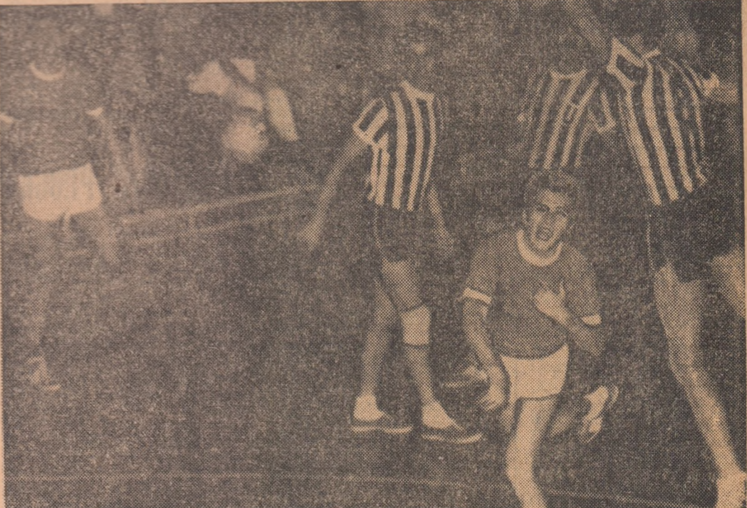
Fază din meciul Dinamo București — Universitatea Cluj, încheiat cu victoria la limită a dinamoviștilor

Cu meciurile disputate ieri a luat sfârșit și manșa a II-a a turneului de sală al campionatului național de handbal, divizia A. Cele trei zile de întreceri au oferit, adeseori, numeroșilor spectatori prezenți în fiecare seară la „Floreasca”, faze de joc palpitante, arătând prin aceasta, încăodată, spectaculozitatea handbalului în 7. Dar iată a-