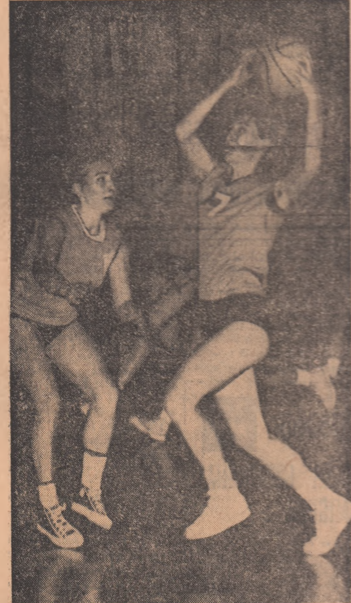
O pătrundere spectaculoasă și Trandafor (I.E.F.S.) va ajunge sub coșul Crișului.

Am poposit deunăzi la Casa de cultură a tineretului din sectorul IV. Era într-o zi, și în încăperile somptuoasei clădiri din strada Turturele se desfășura o reuniune care în amintirile noastre de tinerete se cheamă „ceai”, fiindcă începea la ora 5, se încheia devreme și la ea nu se serveau decât răcoritoare, fursecuri și prăjituri. Obiceiul pare să fi fost, la început, unul englezesc, împrumutat apoi de toată lumea. Casa de cultură i-a respectat întru totul tradiția.