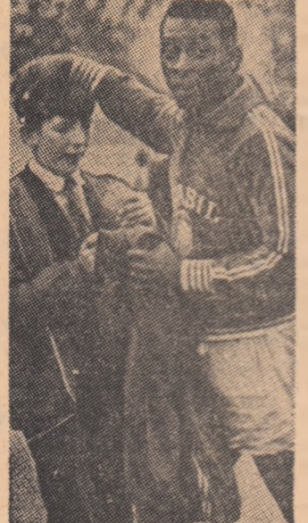
Iată-l pe Pele, asistat de un tânăr admirator.

— Este fotbalul-spectacol în regres? De ce? Cum vedeți viitorul său? — Deviza antrenorilor și conducătorilor de echipă sună cam așa: victorie cu orice preț! Asta înseamnă că rezultatul primează. O asemenea concepție este, în dauna spectacolului. Firește, maniera de joc pentru rezultat, exclude de multe ori fair-play-ul și facilitează accidentările. Eu sînt de părere că spectacolul fotbalistic poate fi salvat numai atunci, cînd, în această problemă, își vor schimba concepția antrenorii, jucătorii, spectatori. Ar trebui urmată o singură deviză: cine este mai bun, să cîștige! Cîștigă pentru a învinge, valorificîndu-ne talentul, etalîndu-ne cunoștințele tactice. Să recunoaștem, întocmită, meritete celui mai bun. Talentele cîștigătoare sînt, pentru ca fotbalul-spectacol să fie salvat. Acestea trebuie puse doar la lumină, lansate și educate spre frumusețea fotbalului!