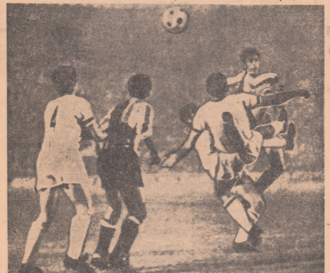
Cinci jucători în luptă pentru balon. Față din primul joc (Milan — Estudiantes 3-0) cînd de fapt italienii și-au asigurat un avans substanțial pentru cucerirea trofeului.