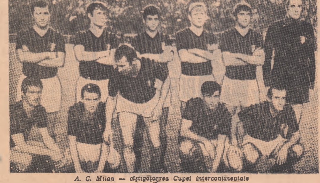
A. C. Milan — câștigătoare Cupei intercontinentale

Se spune că și răul are părți bune. Cu acest prilej s-a confirmat valabilitatea zicelii. Pe de o parte, am putut vedea în timpul acestui meci o „vinătoare de oameni” pușcă de o serie de indivizi care nu merită numele de sportivi sau de jucători de fotbal. Și este de reținut faptul că, în acest caz, milanezii au bătut orice record de stăpînire a nervilor, de self-control. Pe de altă parte, am putut lua act de pedepsele drastice dictate de federația și autoritățile argentine împotriva celor vinovați.