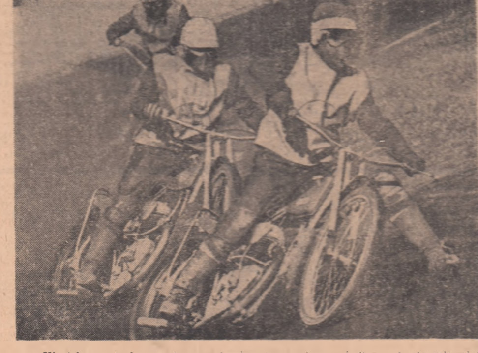
Virajele periculoase, demarajul impetuos, lîtca uimitoare (motoarele sînt acționate cu alcool) — iată numai cîteva din atu-urile dirt-track-ului, care-l fac admirat de public. În fotografie, un spectaculos tiraj surprins de fotoreporterul nostru, la concursul dotat cu „Cupa Metalui”, desfășurat duminică pe baza sportivă de la Pantelimon-Miine, pe aceeași pistă, are loc o nouă etapă în cadrul competiției menționate.