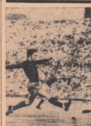
Riva a depășit apărarea galeză și marchează al patrulea gol, în meciul de marți (Italia — Țara Galilor 4-1)

După disputarea a 9 runde, în turneul zonal de șah de la Portimao (Portugalia) conduce marele maestru cehoslovac Miroslav Filip cu 7,5 puncte, urmat de Mariotti (Italia) 7 p., Lewy (Scotia), Bobotov (Bulgaria) 6,5 p., Minici (Iugoslavia), Gligoric (Iugoslavia), 6 p. etc. În runda a 9-a, Gligoric a câștigat la Schaffelberger, Filip la Huguet, Visier la Cordovil, iar Mariotti l-a învins pe Duric.