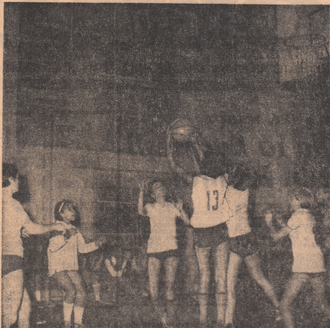
UN PARADIS AL MINIBASCHEIULUI

VOLEI: Sala Progresul, ora 8: Progresul - Șc. sp. nr. 2, Lic. Matei Basarab - Viitorul (m.j), Progresul - C.S.M. Sibiu (f.A), Șc. sp. nr. 1 - Dinamo, Steaua - Rapid (m.j); sala Giulești, ora 8.30: C.S.S. - Șc. sp. nr. 3, Tinerul Dinamovist - Liceul Găești (m.j), Rapid - Farul (f.A); sala Constructorilor, ora 8: Constructorul - Liceul M. Basarab (f.j), Spartac - Medicina Tg. Mureș (f.B), Medicina - Voința M. Ciuc (f.A); sala Palatul Pionierilor, ora 8.30: Șc. sp. nr. 2 - Lic. 2 Pitești, Viitorul - Rapid, Cutezători - Șc. sp. nr. 2 (f.j).