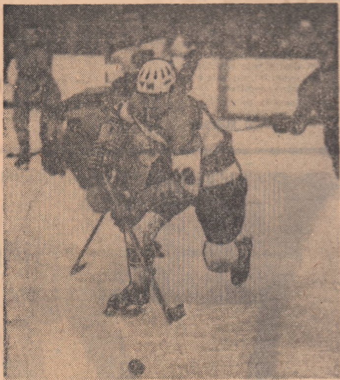
Iuliu Scabo, unul din jucătorii de bază ai echipei Avîntul Miercurea Ciuc, în acțiune

lor bucureșteni care-sî rîd subminate locurile scumbe la începutul campionatului.