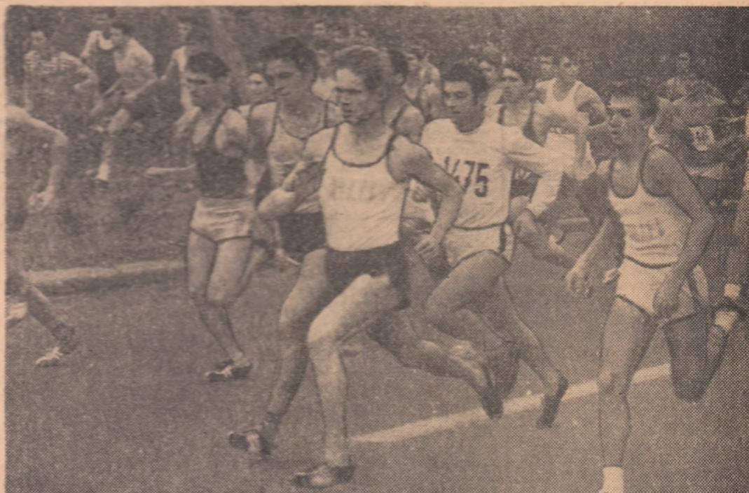
Datorită marelui număr de concurenți (peste 230) startul în cursa juniorilor mari a trebuit să fie dat pe Soseaua Nordului, evident mai largă decît restul traseului.

● CONCURENȚI MULȚI ● SURPRIZE ȘI CONFIRMĂRI