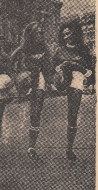
Aceste englezoaice pasionate de fotbal au luat parte la un concurs de frumusețe, organizat de o revistă londoneză, pentru alegerea unei „Miss Football 1969”. În centru, fetele cîștigătoare (în tricou alb), după încoronare...