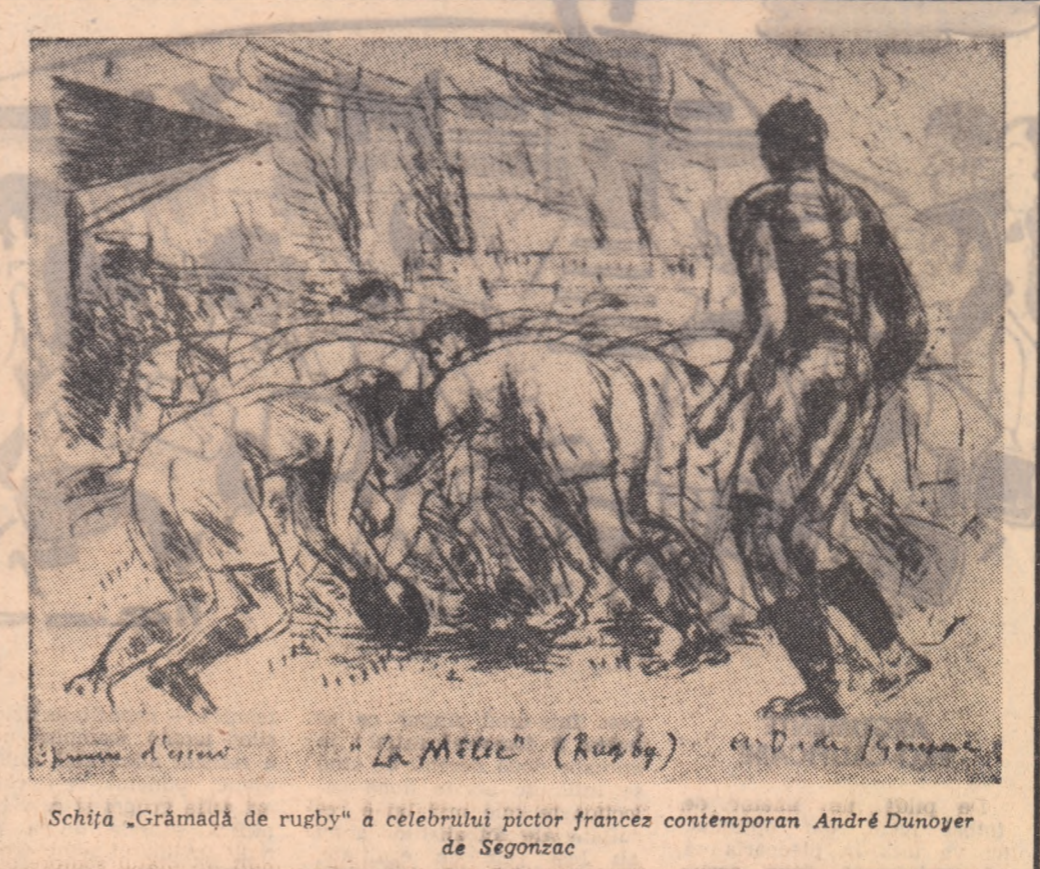
Schița „Grămadă de rugby” a celebrului pictor francez contemporan André Dunoyer de Segonzac

Cnosos, Înainte de a fi răpus de Teseu, se hrănea cu nu mai puțin decît șapte flăcăi zdraveni și șapte fete, implinite, pe săptămîni, divertisment căpădun al adorației Taurului?