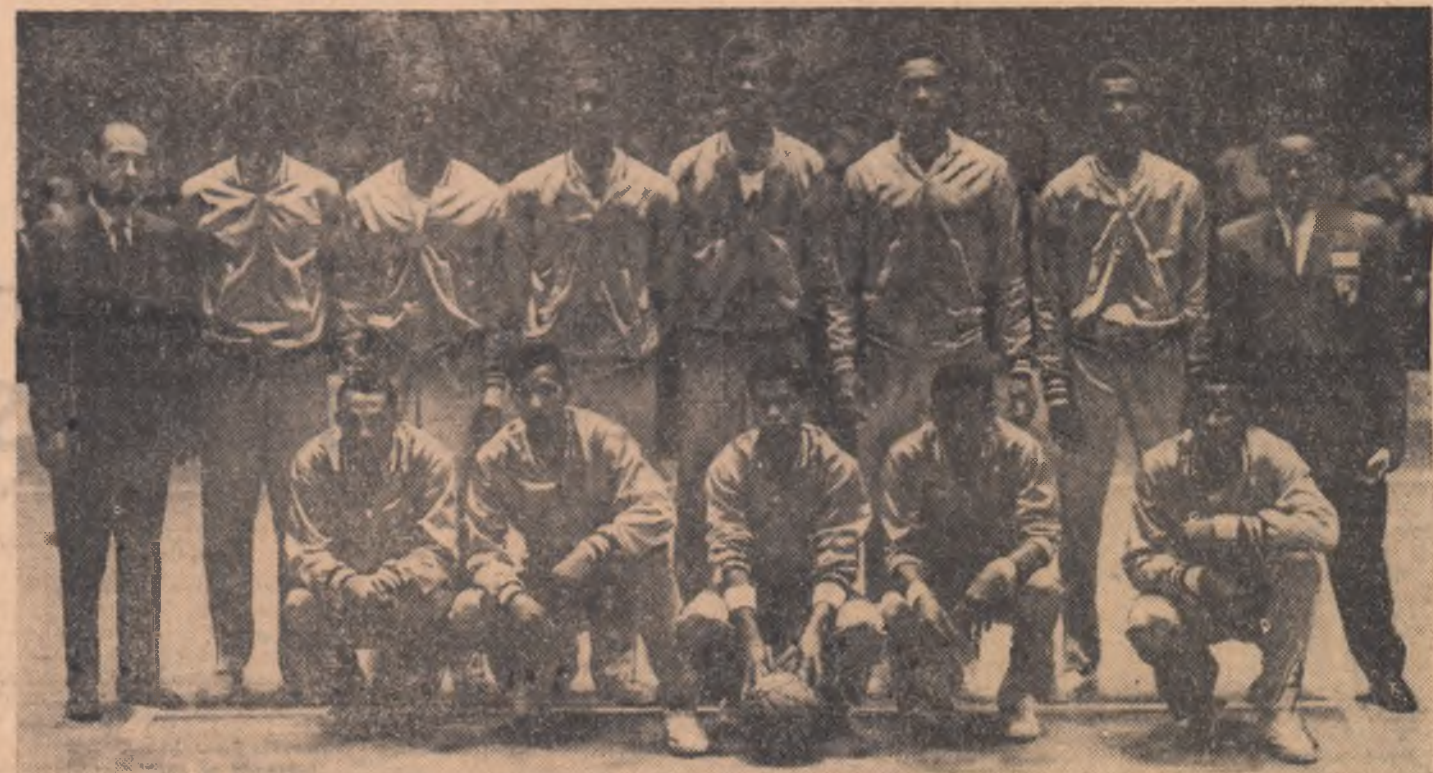
La campionatele mondiale masculine de baschet din anul 1970, pe care le va găzdui Iugoslavia, America Centrală va fi reprezentată de sportivii din Panama, cîștigători ai recent încheiatului campionat. Iată-i, în fotografie, pe campionii de baschet ai Americii Centrale, alinați la ceremonia de premiere.

În clasamentul campionatului, pe primul loc se află T.S.K.A. Moscova cu 37 de puncte din 20 de meciuri (18 victorii, un meci nul și o înfrîngere), urmată de Spartak Moscova — 28 puncte (un joc mai puțin).