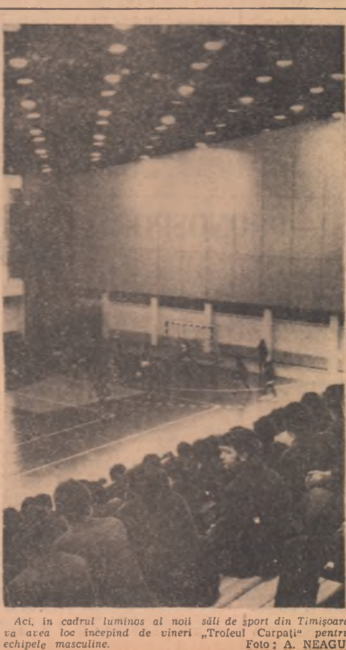
Aci, în cadrul luminos al noii săli de sport din Timișoara va avea loc începînd de vineri „Trofeul Carpați” pentru echipele masculine.