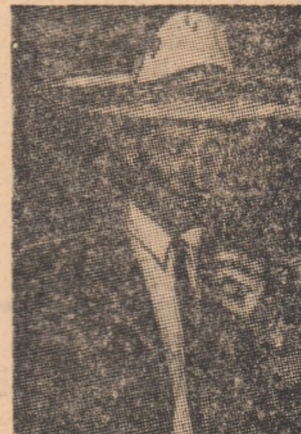
Bobby Charlton caută să intre de pe ac în ambianță mexicană, probînd un sîntentio „sombbrero“...

„Toto“ și „Lotto“, două societăți vest-germane de pronosticuri sportive și loterii vor organiza finanțarea Jocurilor Olimpice din anul 1972. În același timp, mai multe firme industriale au donat Comitetului de organizare a J.O. 5000 de mașini de scris pentru casa presei, 400 de aspiratoare și... 600.000 de bomboane de ciocolată.