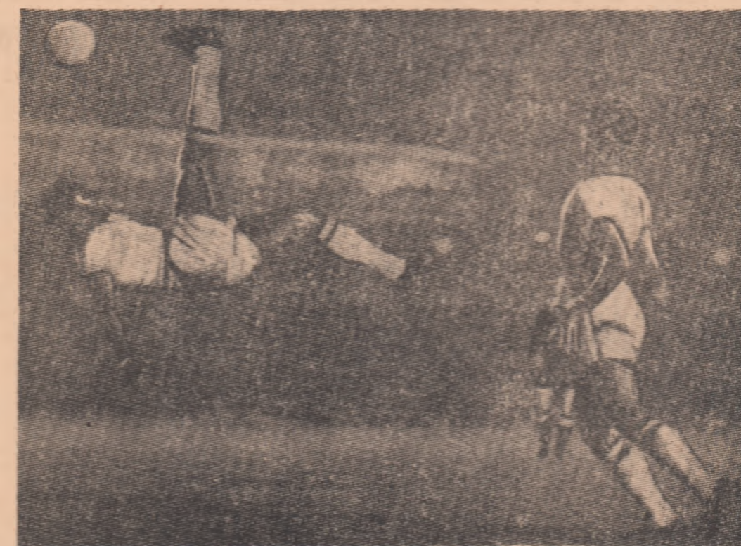
Șoc și eficiența mijloacelor tehnice puse în stîmb obiectivelor tactice urmărite.