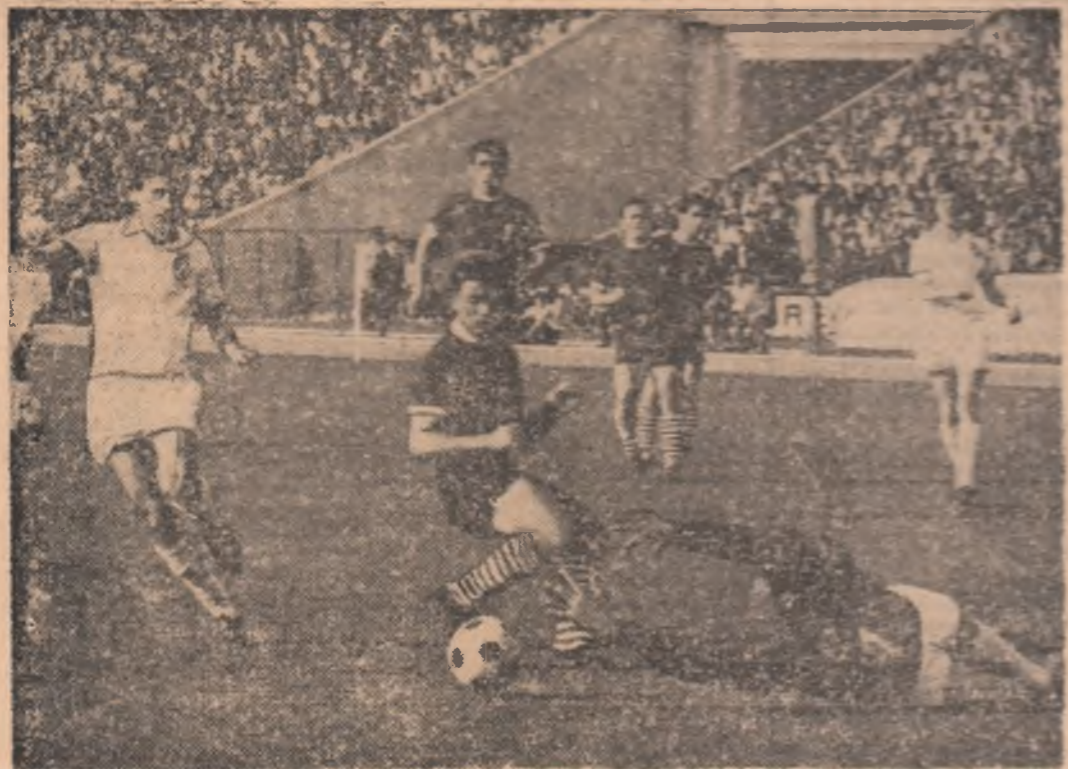
Partidele Rapid — Dinamo au oferit întotdeauna faze de mare spectacol, cum se poate vedea și din fotografia alăturată.