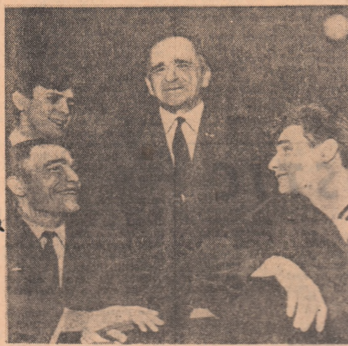
Veșnic tînărul Feliks Stamm, în mijlocul boxerilor polonezi.