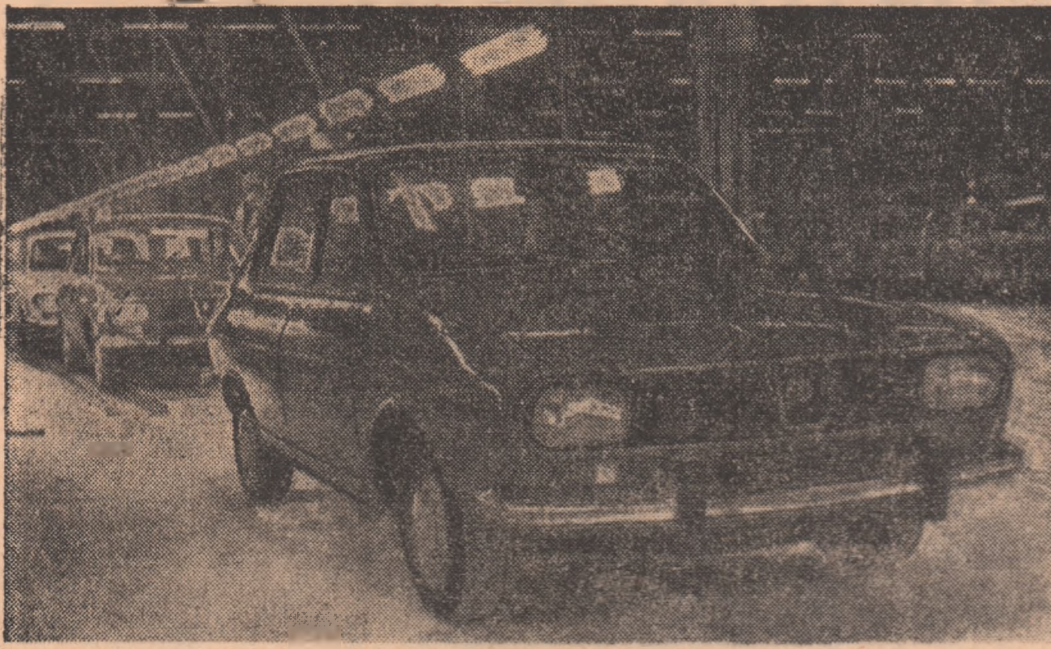
Dacia 1300 tesa de pe banda de montaj

Uzina de autoturisme Pitești crește vâzând cu ochii, se maturizează. Această certitudine o ai nu numai când pătrunzi în halele moderne, scâldate în lumina bateriilor de neon, ci chiar de la distanță. De departe, de pe șoseaua ce duce la Cimpulung, privirea descoperă noile clădiri, printre care un masiv bloc-torn, apărute de curând și destinate să întregesc un complex uzinal vast.