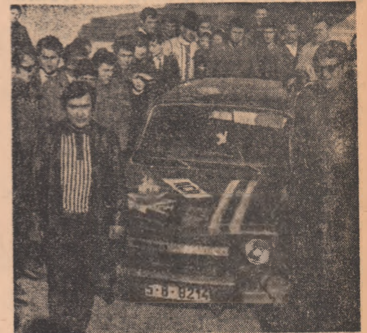
La Iași, înconjurări de public, înainte de plecarea mai departe