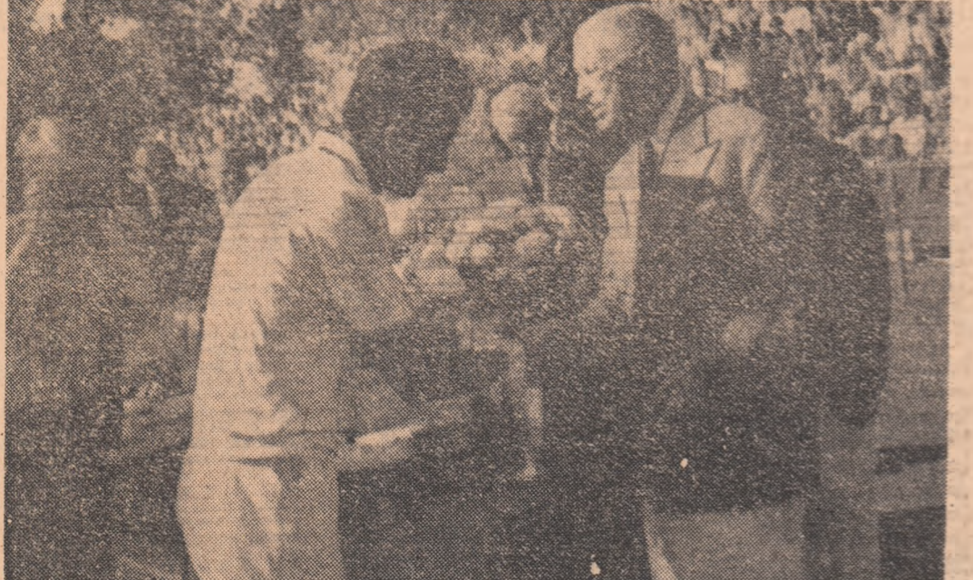
Din albumul de amintiri: după finala turneului de astă vară de la Baastad, Ion Țiriac primește felicitările regelui Gustav al Suediei

● Tenis la ora 1 noaptea! ● „Înainte meciului cu Riessen mi-am luat bilet la avion...” ● În Capitală: întâlnirea Canottieri Milano — Selecționata București ● Ancona; turneele indoor din S.U.A.; Circuitul Caraibelor — viitoarele etape ale jucătorilor români ● Va fi trădată racheta în favoarea volanului?