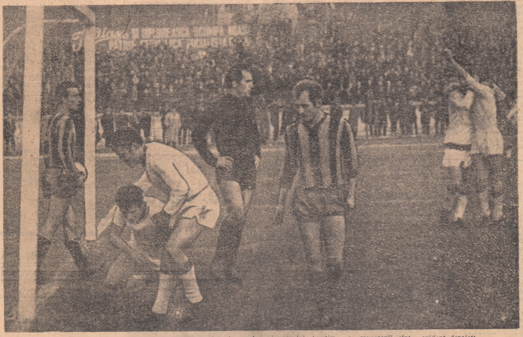
Așa a fost la 3-1: dinamoviștii (în alb) trăiesc intens bucuria golului, în timp ce mureșenii sînt, evident, dezolați.

● Gazdele n-au pierdut nici un joc ● 34 de goluri în ultima etapă a turului ● Final dramatic la Craiova ● Ce mari sînt cele două puncte ale Crișului! ● Dinamo Bacău și-a regăsit busola ● În rest — rezultate scontate