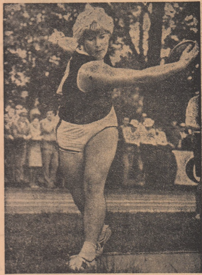
Discul ei zboară peste granița celor 60 metri...

1947: Alex Jany (Franța); 1948: Fanny Blankers-Koen (Olanda) — atletism; 1949: Emil Zatopek (Cehoslovacia) — atletism; 1950: Bob Mathias (S.U.A.) — atletism; 1951: Emil Zatopek (Cehoslovacia) — atletism; 1952: Emil Zatopek (Cehoslovacia) — atletism; 1953: Fausto Coppi (Italia) — ciclism; 1954: Roger Bannister (Anglia) — atletism; 1955: Sándor Iharos (Ungaria) — atletism; 1956: Vladimir Kuț (U.R.S.S.) — atletism; 1957: Vladimir Kuț (U.R.S.S.) — atletism; 1958: Herb Elliott (Australia) — atletism; 1959: Vladimir Kuznețov (U.R.S.S.) — atletism; 1960: Wilma Rudolph (S.U.A.) — atletism; 1961: Valeri Brumel (U.R.S.S.) — atletism; 1962: Valeri Brumel (U.R.S.S.) — atletism; 1963: Valeri Brumel (U.R.S.S.) — atletism; 1964: Don Scholander (S.U.A.) — înot; 1965: Ron Clarke (Australia) — atletism; 1966: Jim Ryun (S.U.A.) — atletism; 1967: Jim Ryun (S.U.A.) — atletism; 1968: Bob Beamon (S.U.A.) — atletism și Vera Ceaslavskia (Cehoslovacia) — gimnastică; 1969: Eddy Merckx (Belgia) și Liesel Westermann (R.F.G.) — atletism.