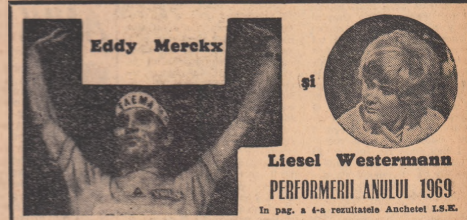
Eddy Merckx și Liesel Westermann PERFORMERII ANULUI 1969

MOSCOVA 9 (Agerpres). - Afiată în turul în U.R.S.S., selecționata feminină de handbal a orașului București (tineret) a susținut până în prezent trei meciuri la Kiev. În primul joc tineretele handbaliste române au jucat cu formația locală Avangard, pe care au învins-o cu scorul de 15-13 (11-5).