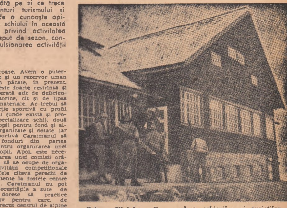
Cabana Virful cu Dor, oază a schiorilor și turistilor de pe Valea Prahovei

Valea Prahovei, leagăn al schiului, capătă pe zi ce trece alte contururi, deschizând noi orizonturi turismului și schiului de performanță. În dorința de a cunoaște opiniile celor care se ocupă direct de destinele schiului în această zonă, am considerat oportună o discuție privind activitatea prezentă și de viitor, mai ales acum la început de sezon, convingi că, prin aceasta, vom contribui la impulsivitatea activității sub multiplele ei fețe.