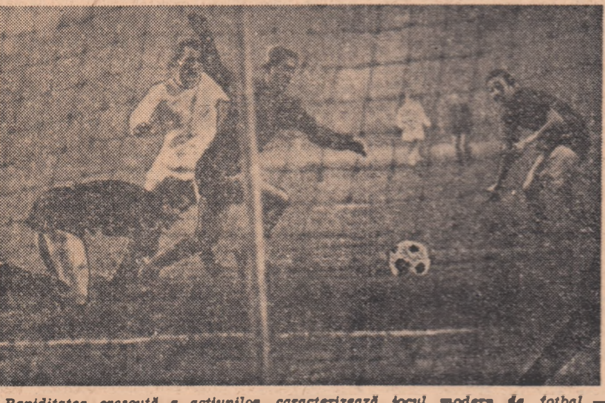
Rapiditatea crescută a acțiunilor caracterizează jocul modern de fotbal - afirmă specialiștii

Cu ce este superior fotbalul practicat în zilele noastre față de cel jucat cu decenii în urmă? Iată o întrebare care continuă să-i frământa pe specialiștii.