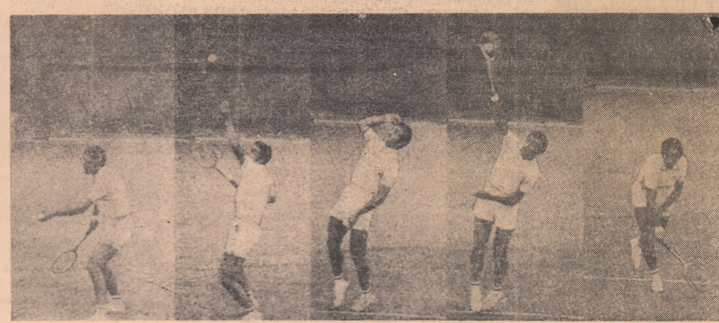
Servește Tîriac! Kinograma lui Gil de Kermadec din serialul său „Arta apărării” prezintă și una din armele de atac ale tenismanului român