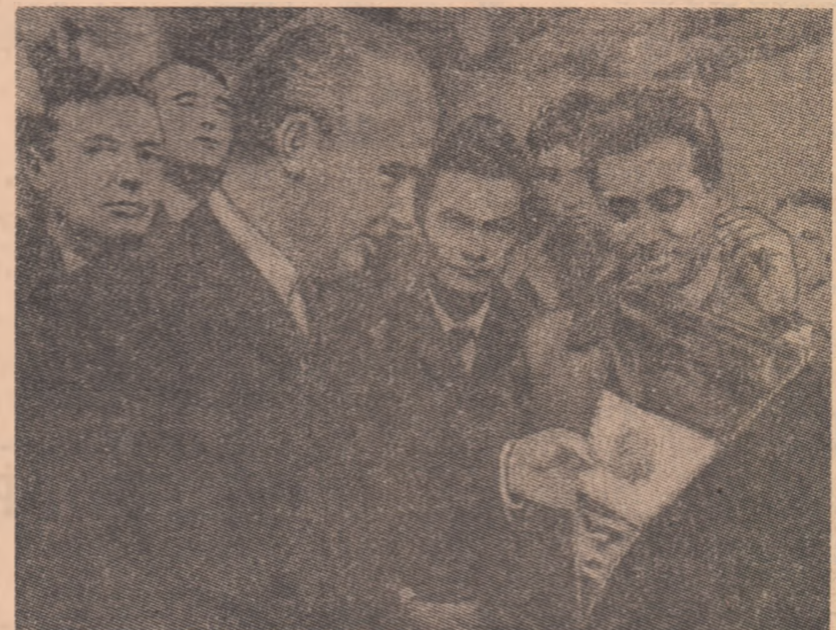
O frumoasă amintire a pugiliștilor români: întîlnirea cu dr. Hillery, ministrul afacerilor externe al Irlandei. Din „THE IRISH PRESS”