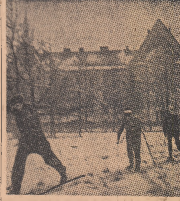
Schiorii Școlii sportive din Gheorghieni au ieșit pe prima zăpadă — deocamdată în curtea liceului.