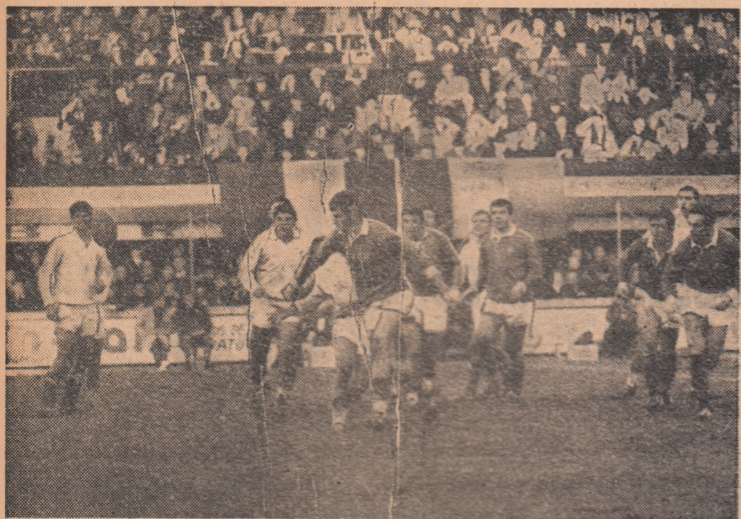
Fază din ultima confruntare rugbystică franco-română, găzduită de Franța (Nantes, 10 decembrie 1967). În echipament alb — românii.

Trimisul nostru special în Franța, DAN GĂRLEȘTEANU, transmite telefonic: