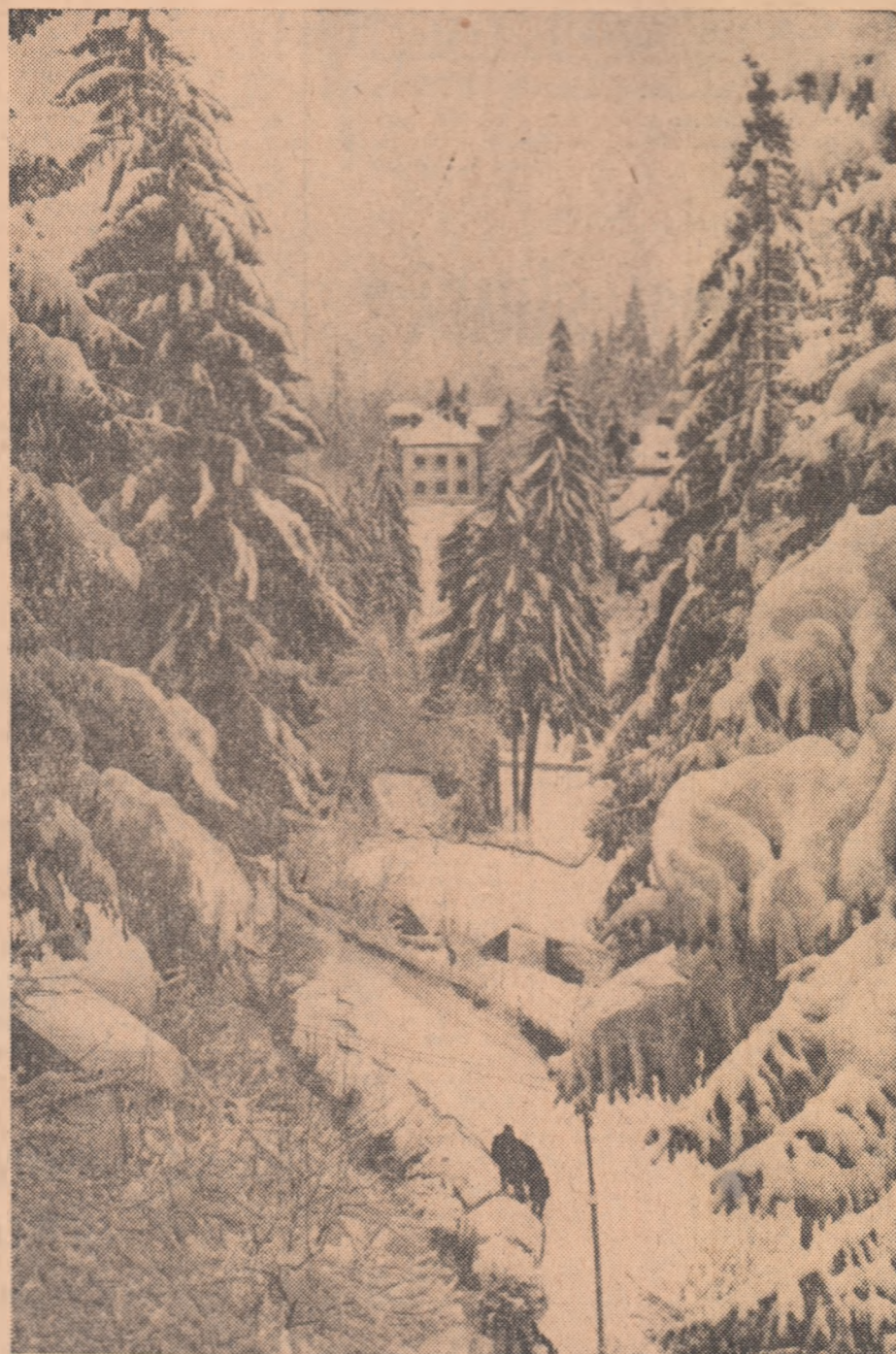
Munții vă invită...