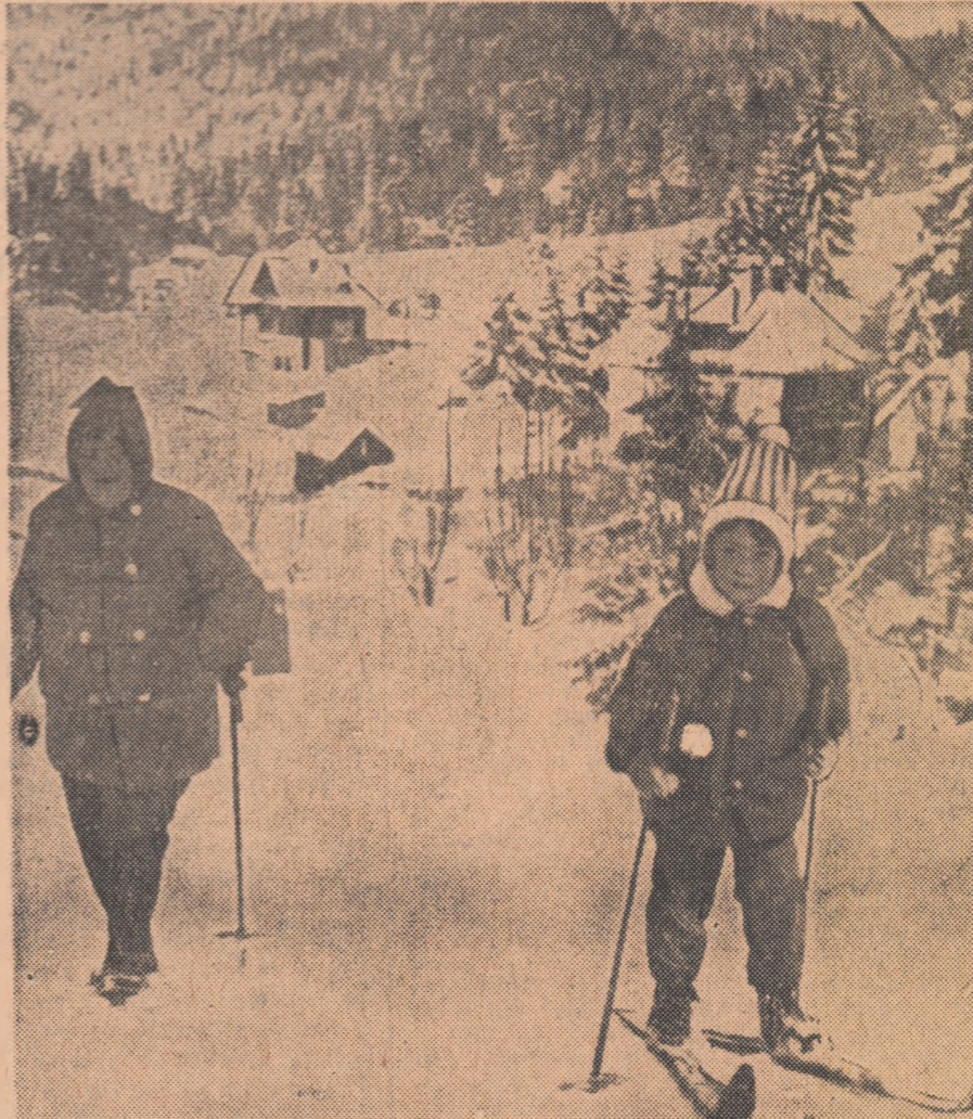
Pe pîrtia de la Clăbucet, două gene rații și o pasiune. SCHIUL