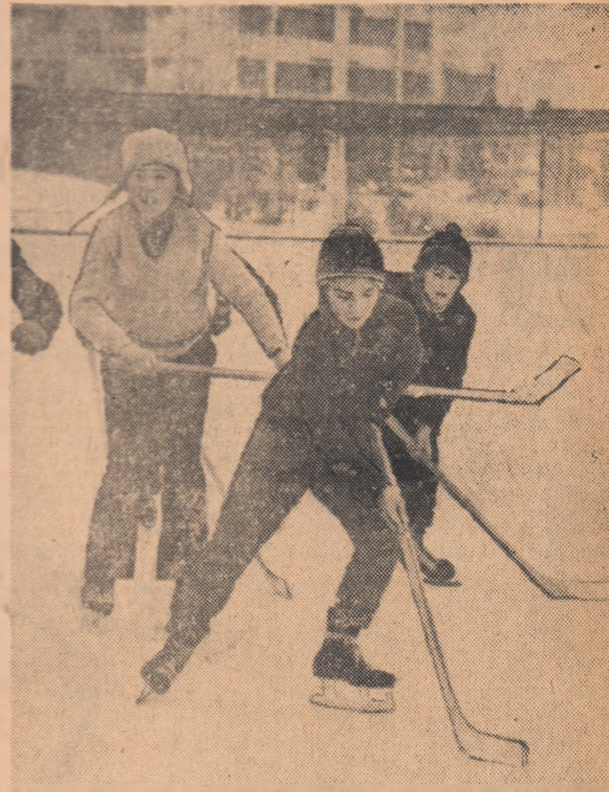
Mingea a rămas pe undeva, prin casă. Iarna, hocheiul este la modă și copii îl practică cu plăcere pe arene improvizate, dar cu ambiția marilor dispute.

În drum spre Austria reprezentativa noastră va sus-