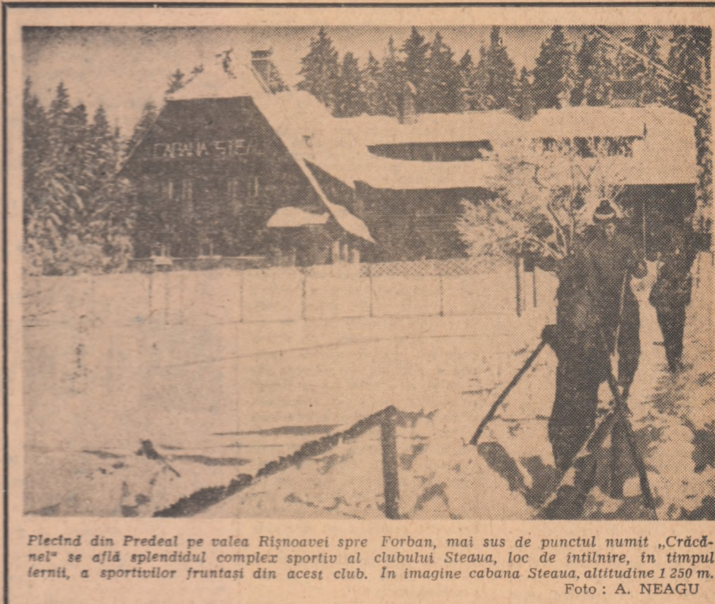
Plecînd din Predeal pe valea Rîșnoavei spre Forban, mai sus de punctul numit „Crăcnel” se află splendidul complex sportiv al clubului Steaua, loc de întîlnire, în timpul iernii, a sportivilor fruntași din acest club. În imagine cabana Steaua, altitudine 1.250 m.