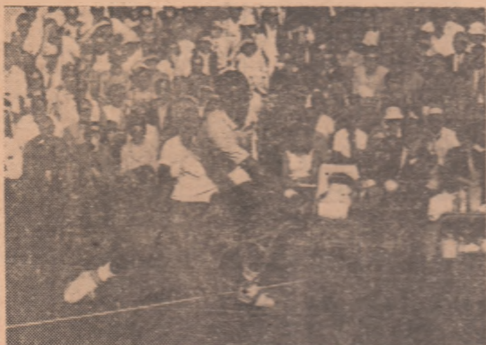
Echipierul nr. 1 al deținătorilor „salatierii”, americanul de culoare Arthur Ashe

la Cleveland. Acolo trebuia să întâlnim, în zilele de septembrie, pe deținătorii „Salatierii de argint”, tenismanii reprezentativei S.U.A. Așa că nu era posibil să greșim. În această acceptare. Trebuia să mergem cit mai de vreme la