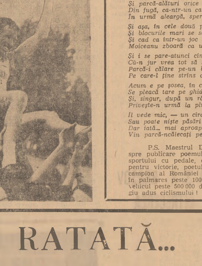
Un moment din concursul mondial pentru titlul de campion mondial al ciclismului în categoria masculini, realizat de Jacques Anquetil în 1957.

prunat, avem convingerea că Jacques Anquetil nu va putea sta departe de sportul pe care l-a iubit cu adevărat... SI CICLISMUL POLONEZ A SĂRBĂTORIT ANUL TRECUT 100 DE ANI DE LA PRIMĂ ÎNTRECERE CICLISTĂ ORGANIZATĂ PE MELEGURILE POLONIEI.