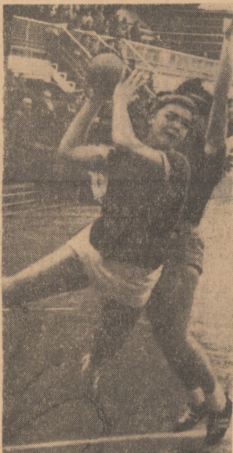
Nepțina („U” Timișoara), într-una din acțiunile ei la semicerc, înscrie spectaculos.

CONSTRUCTO- RUL TIMIȘOARA — RAPID 11-7 (3-3). Meciuul ultimelor două clasate nu a prilejuit, așa cum era de așteptat, un spectacol de calitate. Au câștigat pe merit timișorencele care, excepționabil primele 20 de minute au avut inițiativa. Ca și în prima etapă feroviară au început jocul în viteză și după 9 minute conduceau cu 2-1. Treptat, bucurătențele au acționat din ce în ce mai slab, pierzând avantajul (min. 22: 3-3). Repriza secundă a aparținut în întregime handbalistelor de la Constructorul care s-au detașat ca urmare a unui joc mai bun. Au fuzuris: Franz (5), Oprea (3), Pavel (2), Gavrilov — Construc-