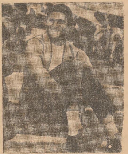
Album sportiv bucureștean: Eusebio