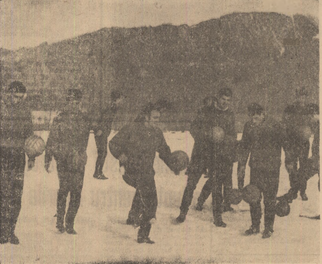
Controlul balonului la altitudine. I-ași recunoscut, desigur, pe rapidiști, despre care veți afla amănunte în ziarul nostru de mîine