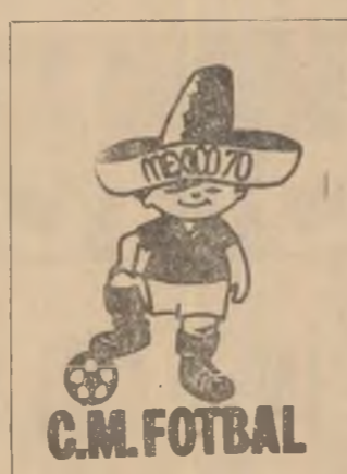
lescu dorea să facă parte dintr-o serie puternică, intrucit echipa română, confirmind progresele certe din ultimii ani, și-a atins țelul urmărit: acela de a fi prezentă, cu cea de a doua reprezentantă a fotbalului latin (european) la Mexic.

Asta în ce privește seria I-taliei. Cit despre cea a României, însă — nu putem decât să ne repetăm: unsprezecele danubian nu a fost deloc favorizat de sorți. Dar, urmind declarațiile lui Angelo Niculescu, în cursul unui interviu acordat cotidianului „Stadio” din Bologna, într-un fel România este mulțumită. Nicu-