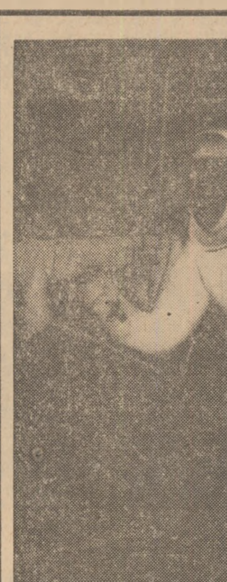
scoterea din ritm a adversarului”. Referind-se la faptul că echipa Braziliei nu are încă un portar titular și că în perspectivă sînt doi portari încă neverificați, Geoffrey Green scrie, că numai aceasta nu poate constitui un motiv de liniște pentru Anglia...