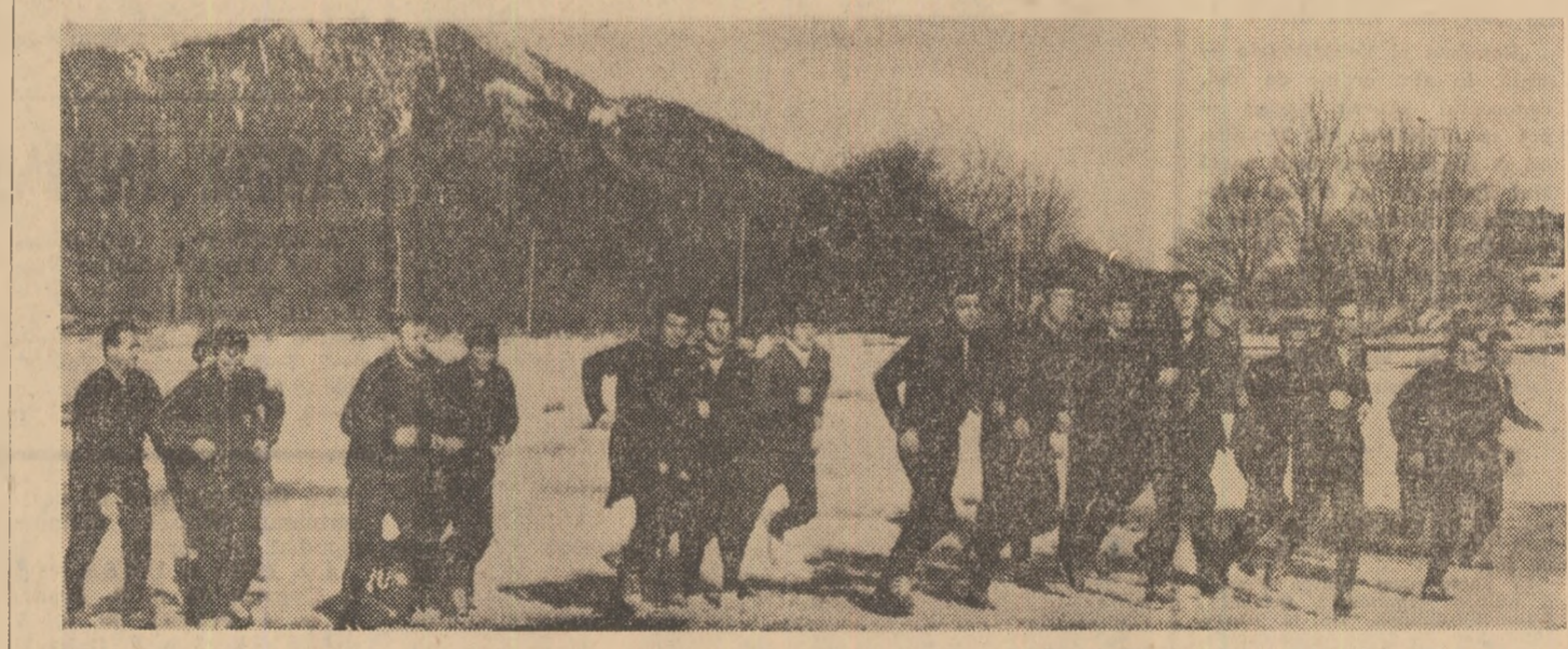
Jucătorii Progresului iau startul...

majoritatea dintre ei o merită. De ce vă spun toate acestea? Pentru că victoria sau eșecul de ieri sau de mîine, spectacolul cu decor și costume al campionatului, nu lasă să se vadă dirzenia și stoicismul cu care acești fotbalisți, unii trecuți deja de prima tineretă, alții abia gîndind performanța, se luptă în aceste zile cu ploaia și noroiul, cu zăpada și gerul. Eu l-am văzut ieri, alaltăieri, pe cei de la U.T.A. Știu, mulți imi vor replica, de aceea am devenit sentimental, că fotbalisții aceștia mai au niște răni de oboljot. Dar am să le răspund că cei care aleargă într-o după-amiază 10.000 de metri, prin noroi și ploaie torențială, pe malul Mureșului, fără să crucească, după ce dimineața lucraseră o oră într-o sală de loc primitoare, cu haltere și aparataj auxiliar, niște exerciții pe cît de oboșitoare, pe atît de plicticoase (chiar dacă sint nece-