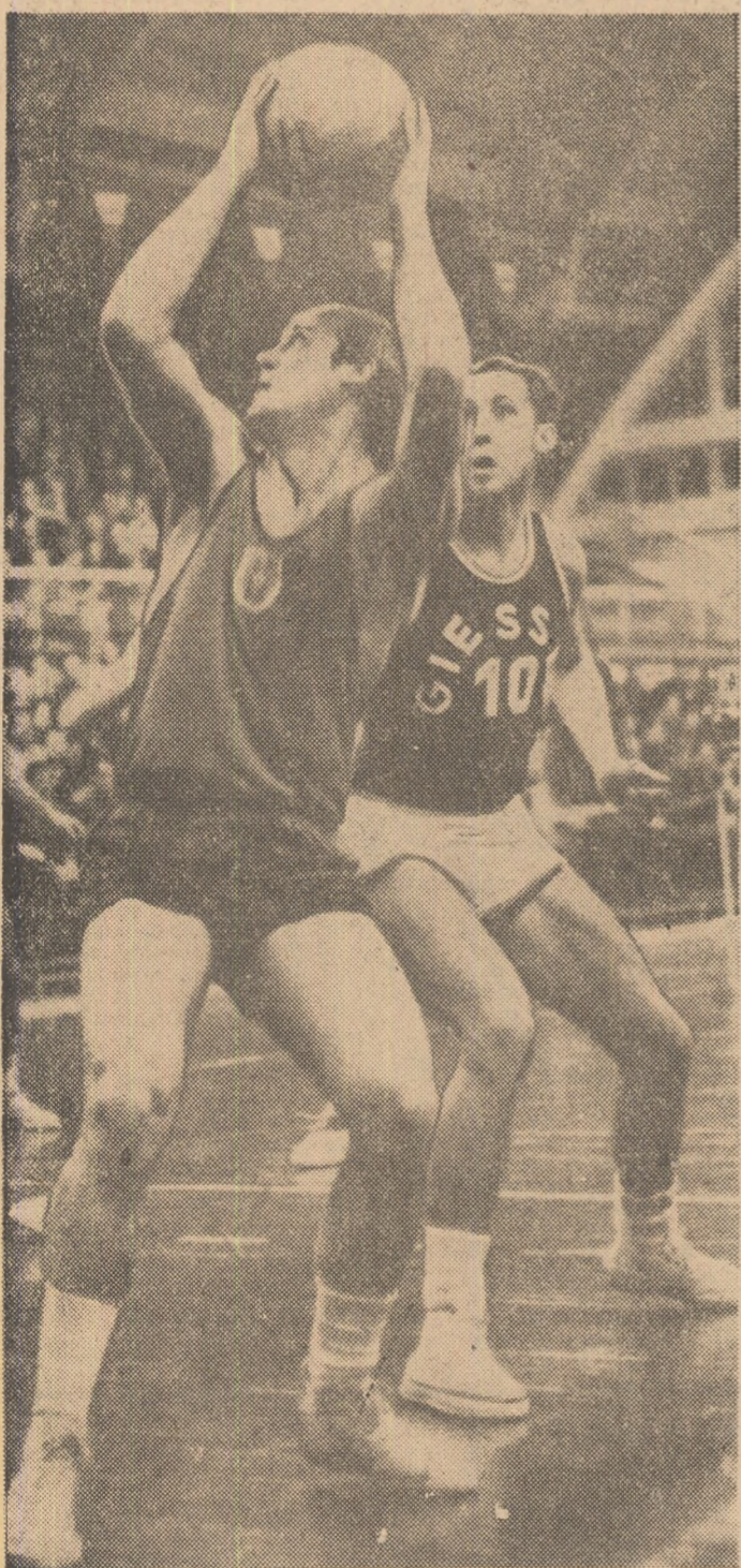
Steaua va încerca duminică să recupereze handicapul de la Varșovia din meciul susținut cu Polonia în cadrul „Cupei cupelor” și să pășească în turul următor al competiției. În imagine, Gzmor (Steaua)