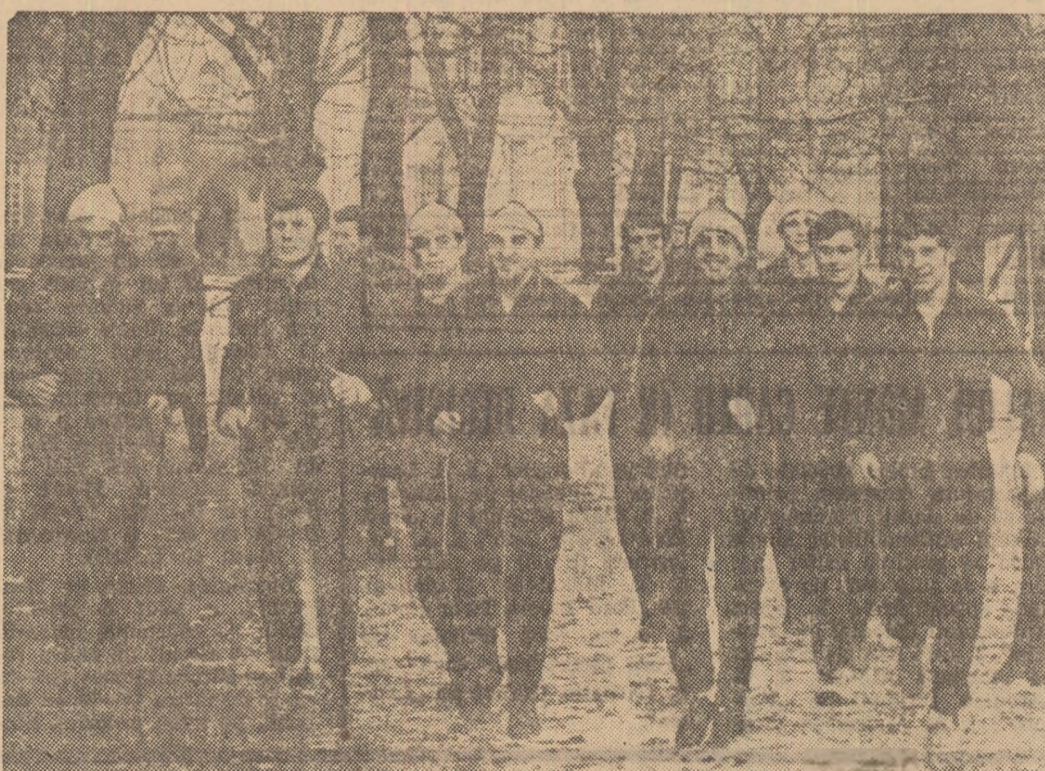
Acașă, pe Mureș, acolo unde jucătorii ardeleni își efectuează întregul stagiu de pregătire în vederea returului

Echipa A.S.A. Sibiu a avut o comportare nesatisfăcătoare