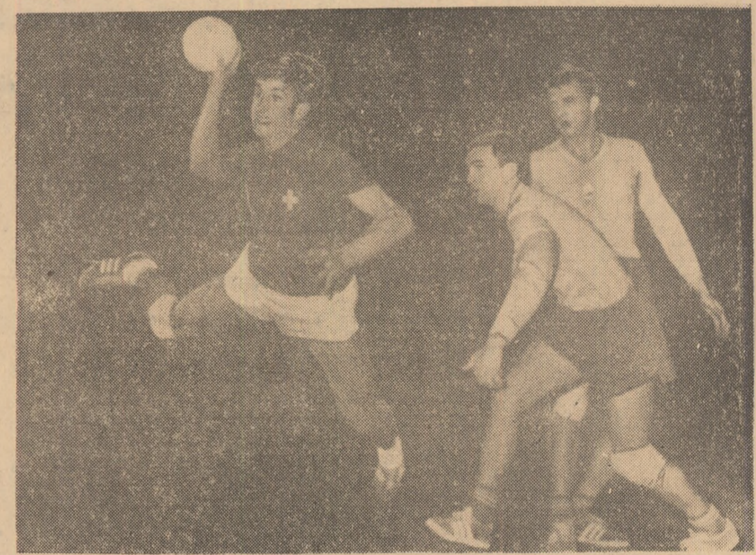
Imagine dintr-o recentă confruntare România — Elveția, cîștigată de handbaliștii români cu 22—10. Cele două echipe se vor întîlni din nou în întrecerile grupei C ale C.M.

Iugoslavia, aflată pe locul secund, a avut o evoluție destul de constantă, marcată doar pe alocuri de cîteva rezultate surprinzătoare (18—22 cu Danemarca, 18—19 cu Japonia pe teren propriu). Sin-