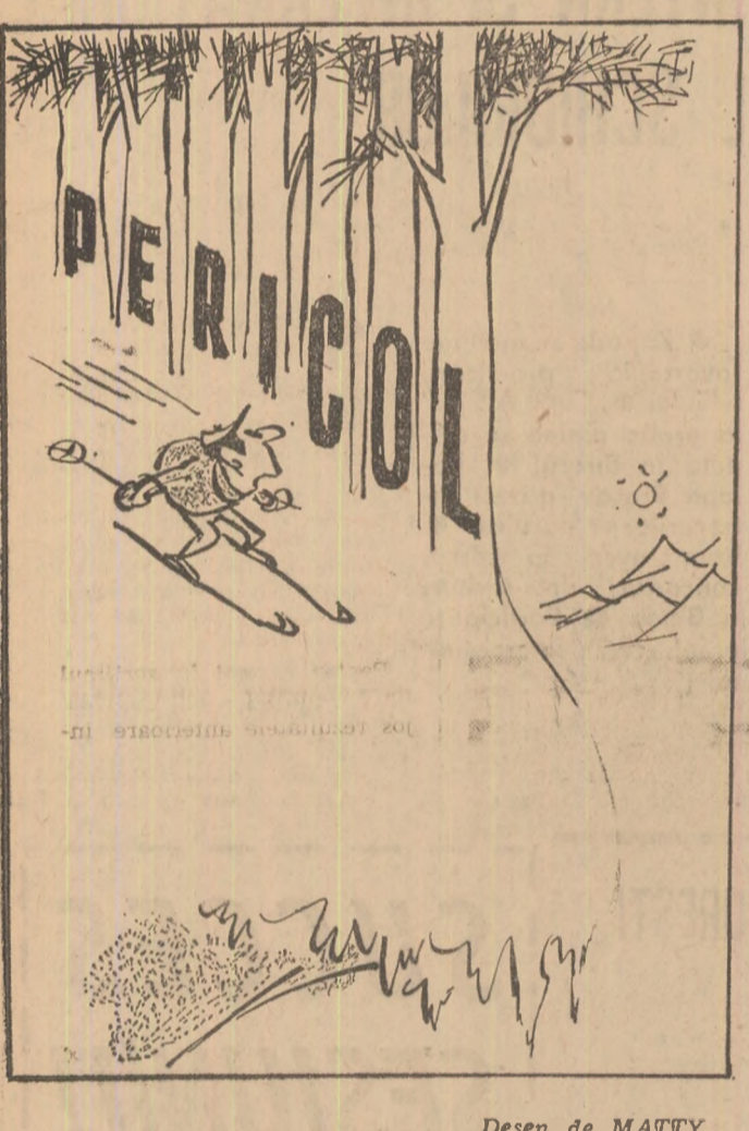
Desen de MATTY

Incheiem aceste rânduri cu o întrebare: va însemna cu cerirea categoriei Onoare o simplă treaptă în drumul P.T.T. spre divizia B și, de ce nu, spre prima categorie a țării?