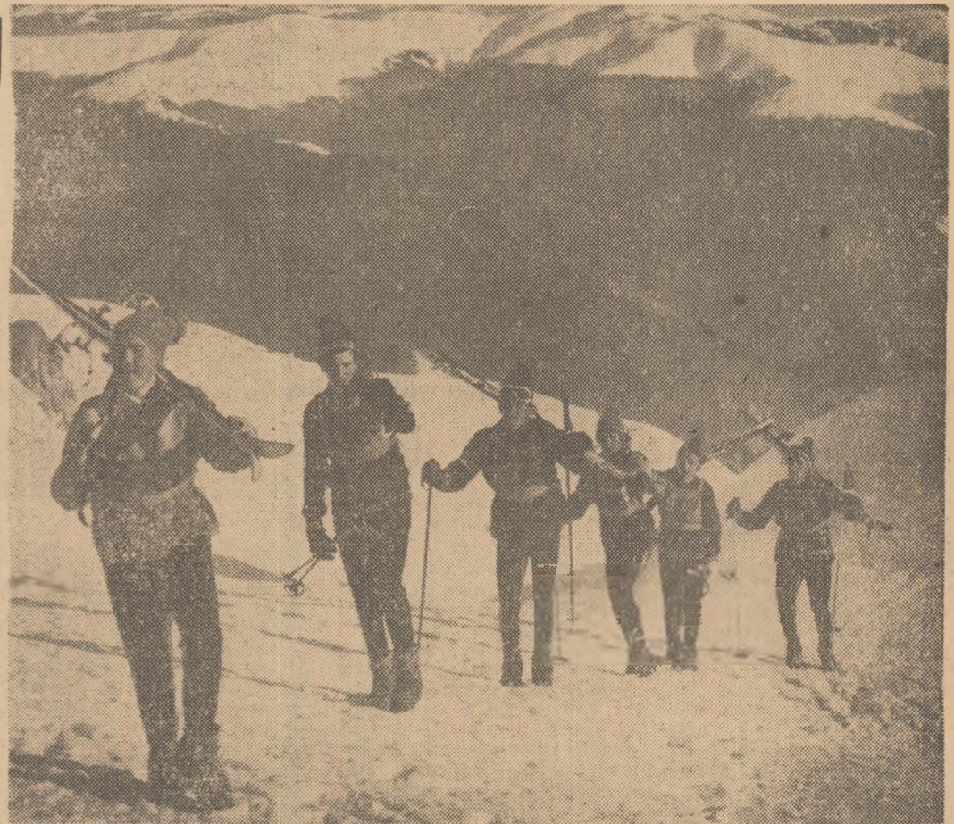
În drum spre locul de start

Între 25—28 ianuarie va avea loc în Capitală cea de a II-a consfătuire a antrenorilor de fotbal care activează în cadrul centrelor de copii și juniori. Consfătuirea se va desfășura la complexul sportiv „23 August”.