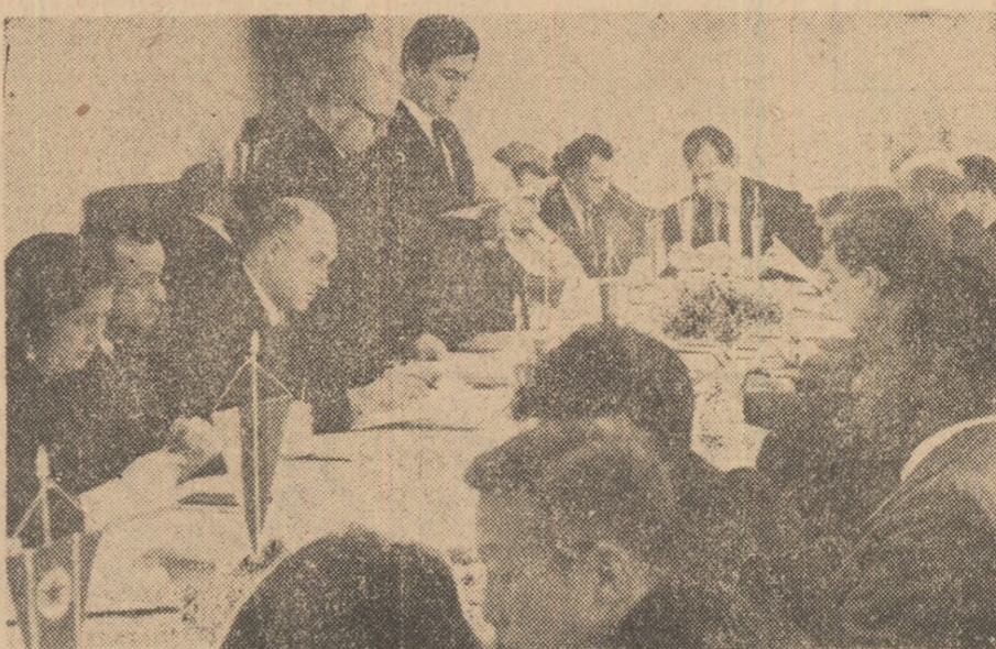
Aspect din timpul lucrărilor reuniunii

În Capitală a început ieri cea de a V-a reuniune a Comisiei de planificare pentru concursurile de tineret, „Prietenia”, ale sportivilor din țările socialiste. Pe ordinea de zi a lucrărilor figurează: