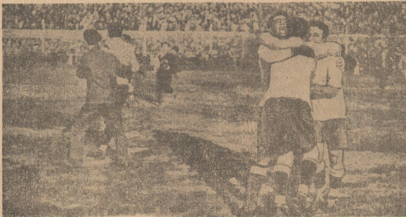
Bucuria uruguayenilor, primii învingători în „Cupa Mondială”, nu cunoaște margini