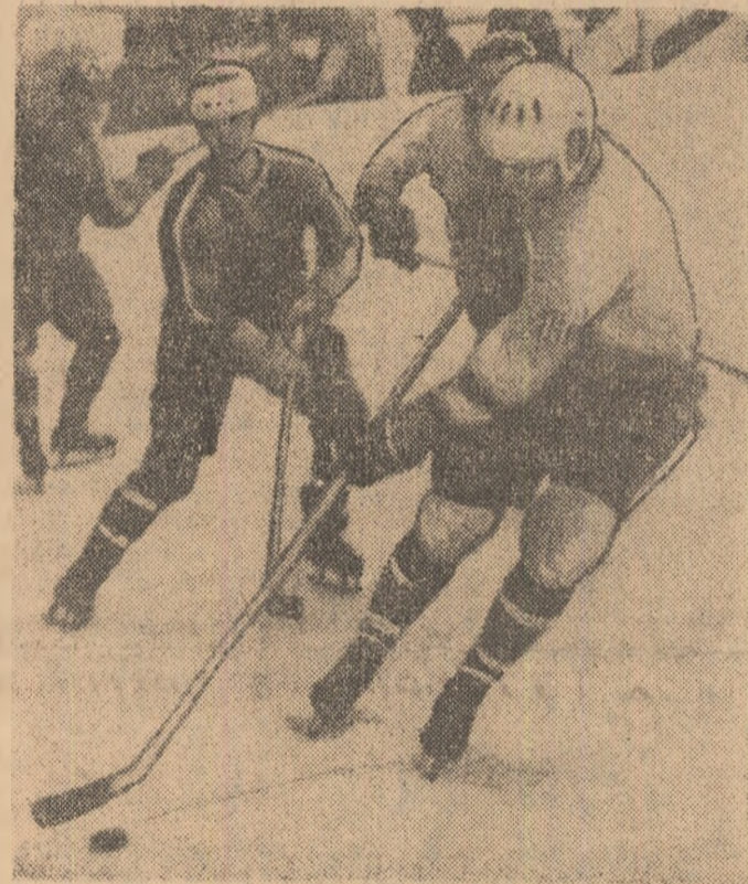
Un moment din meciul Motor Ceske Budejovice — București (B). Atacă hocheiștii cehoslovaci