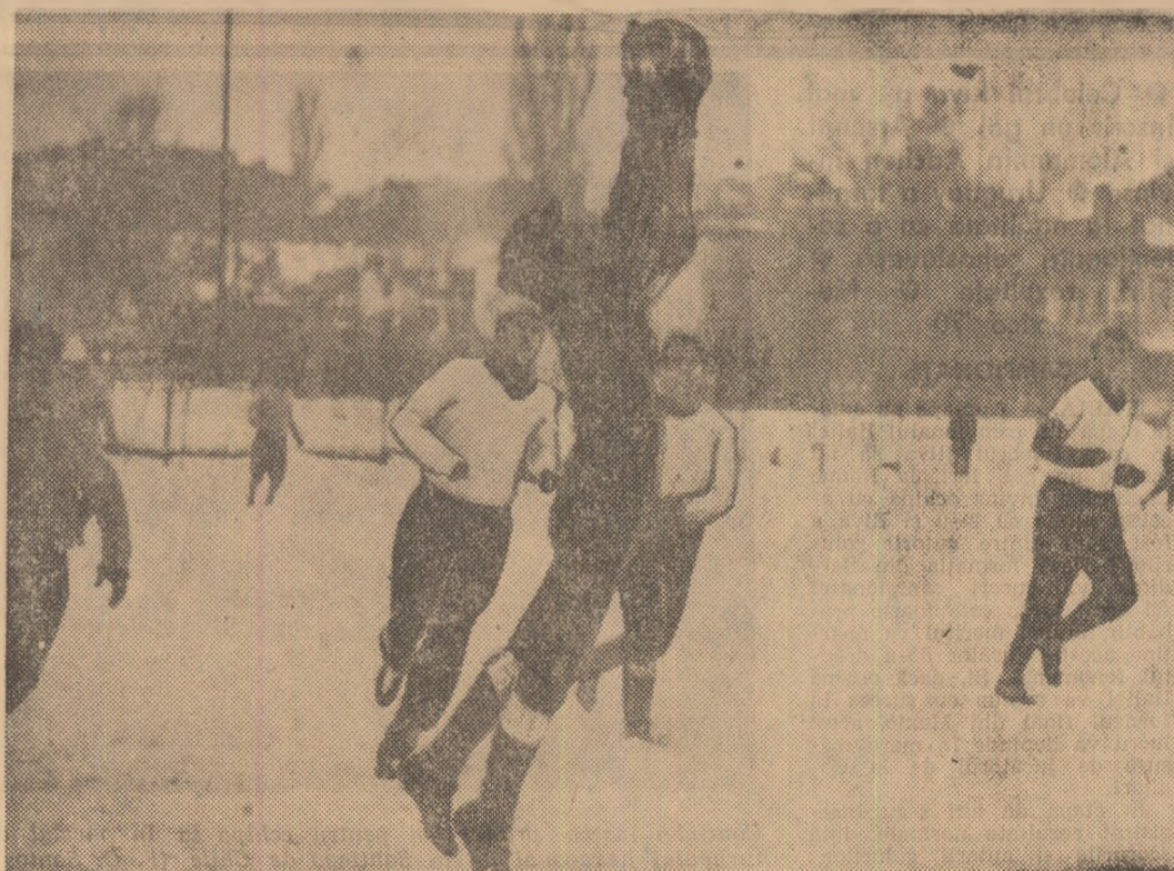
Fotoreporterul nostru V. Bageac a surprins, pe peliculă, o acțiune ofensivă a jucătorilor...