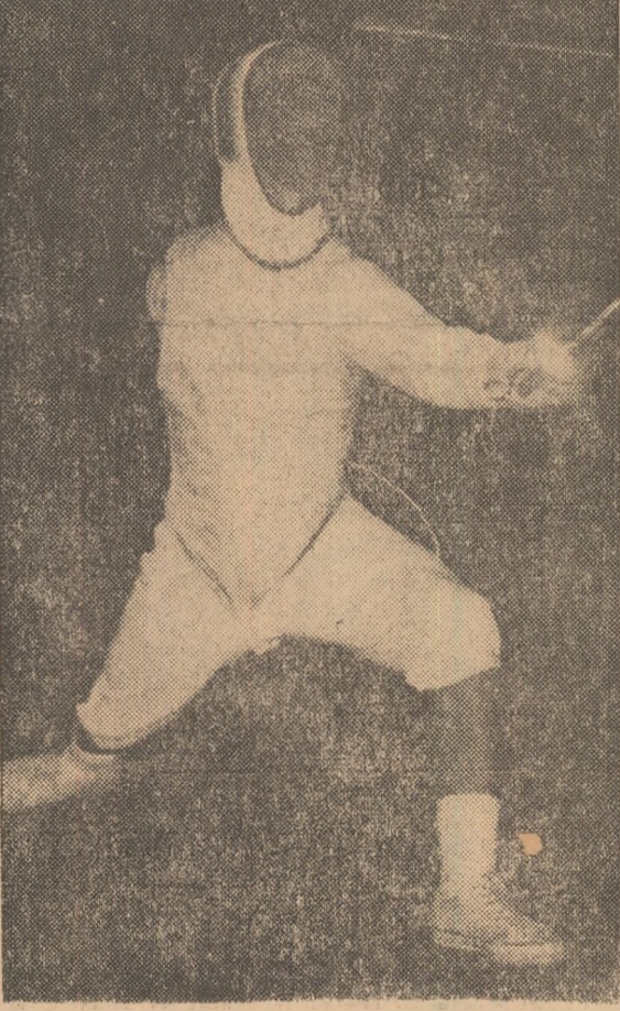
Campionul olimpic la floretă, Ionel Drîmbă, câștigătorul ultimei ediții a „Cupa Martini”, într-o poziție caracteristică