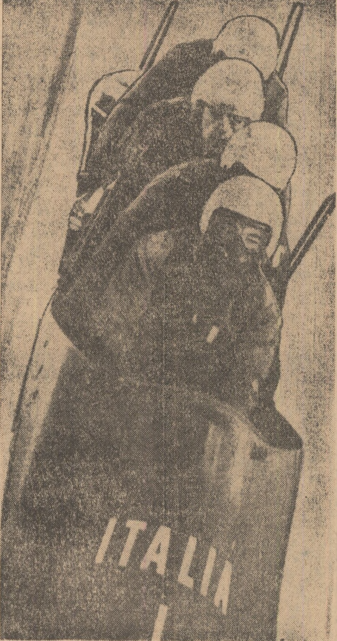
Campionii mondiali în drum spre titlu...