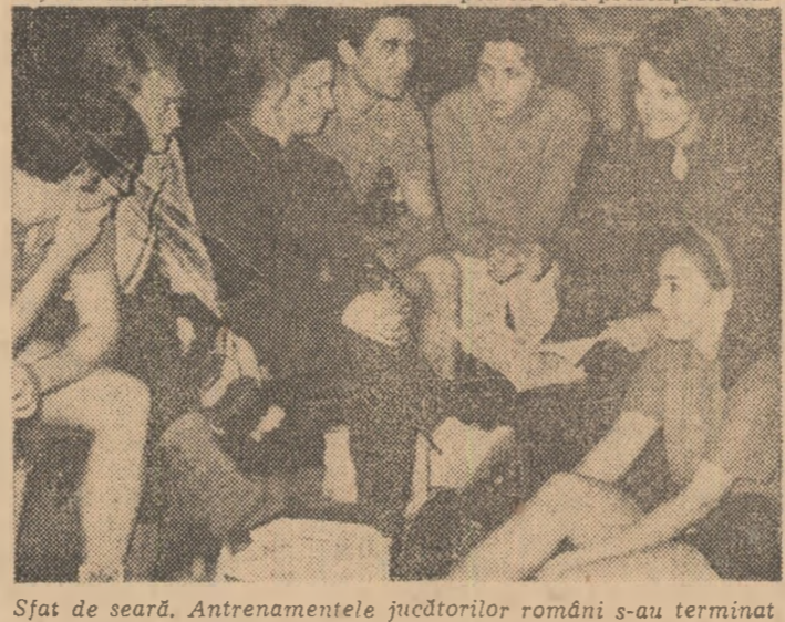
Sfat de seară. Antrenamentele jucătorilor români s-au terminat