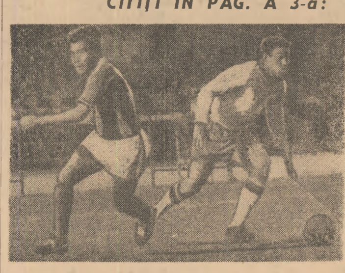
Un dribling „semnat” Garrincha, asul atacului brazilian la ediția Ghile '62