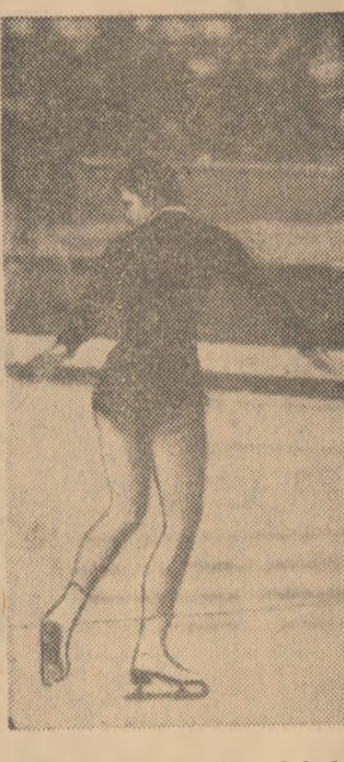
Austriaca Beatrix Schuba în timpul exercițiilor impuse