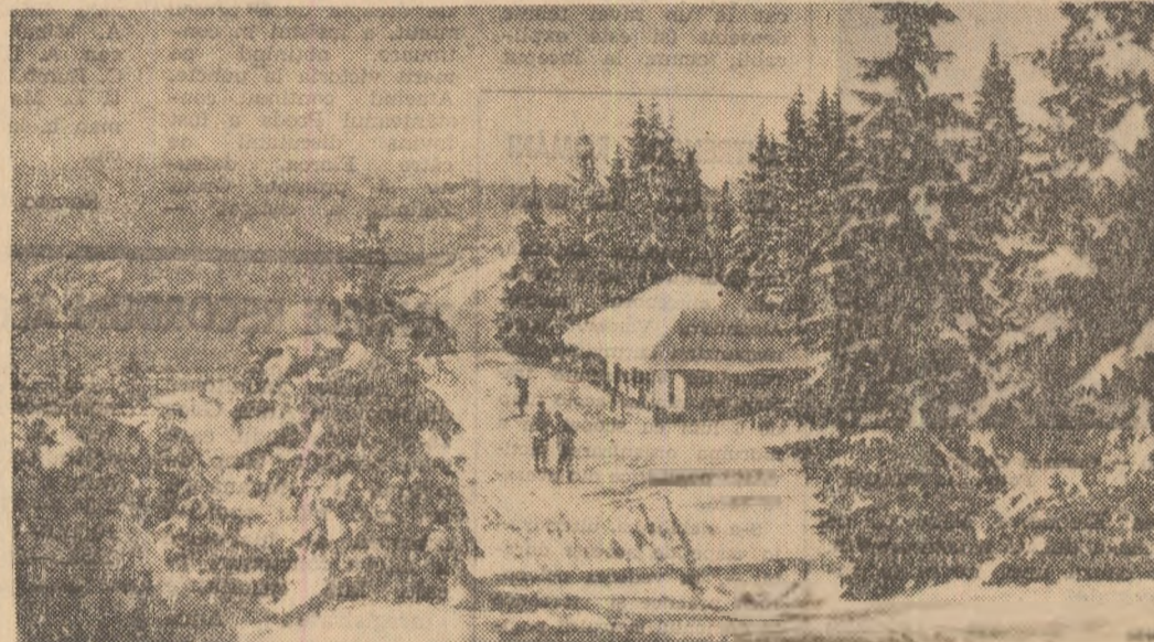
Pîrtia de schi din Poiana Ruscă