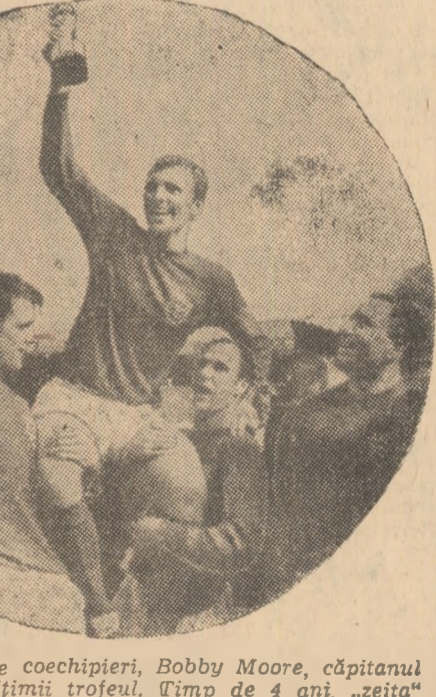
Purtat pe brațe de coechipieri, Bobby Moore, căpitanul echipei, arată mulțimii trofeul. Timp de 4 ani, „zeița” va rămîne în țara care a creat fotbalul