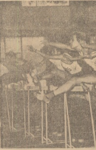
Finala cursei de 50 mg, la sfinșitul căreia timișoreanul Ion Vasilescu a înregistrat un nou record: 7,0 sec.