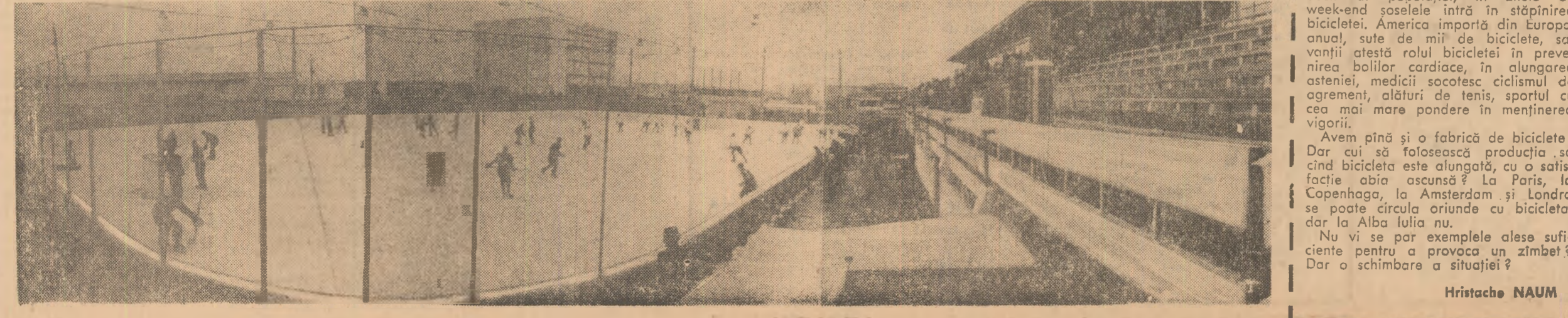
Vedere panoramică a noului patinoar artificial din Galați.