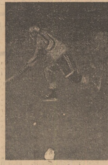
Cupîul nostru de fundași nr. 1 Ionîț (în prim plan) — Varga ezersează... (Continuare în pag. a 3-a)