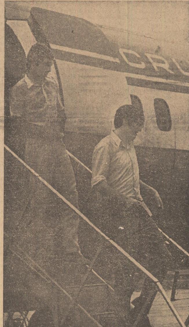
Nunweiler VI și Lucescu coboară din avion la Belo Horizonte

SINAIA, 18 (prin telefon). După nesfîrșite amînări, provocate de capriciile vremii, miercuri 6-au desfășurat primele două manșe ale campionatului național de bob pentru echipele de tineret. Clasament după două manșe: 1. C. S. O. Sinaia (Stoian—Panăteșcu) 1:42,45; 2. Bucegi I Sinaia (Bursea — Turea) 1:44,46; 3. Bucegi II Sinaia (Benghiu—Tătuță) 1:46,50; 4. Volnța I Sinaia (Vulpe — Eftimie) 1:48,09; 5. Carpați Sinaia (Dragomir II—Ioșif) 1:47,46; 6. Volnța II Sinaia (Bilă — Stanciu) 1:48,13. M. BOTA-coresp.