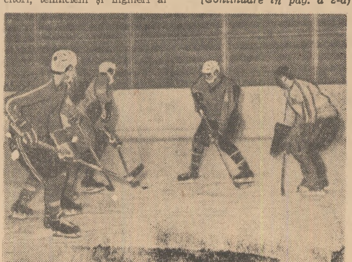
Fericiți că, în sfîrșit, se pot antrena în volei pe „teren propriu“, hocheiștii noștri au asaltat ieri la amiază dreptunghiul de gheață de la „23 August“.

Studioul de televiziune ne-a comunicat datele numeroaselor transmisii acordate C.M. de hochei — grupa B, care va începe săptămîna viitoare în Capitală. Iată datele acestui bogat program al emisiunilor sportive: marți 24.II. ora 17,45 R.F. a Germaniei — Iugoslavia (reprizele a II și a III-a, transmise direct); ora 21,00: România — Norvegia; joi 26.II. ora 21,00: România — Iugoslavia; vineri 27.II. ora 18,30: Statele Unite — Iugoslavia; ora 21,00: România — Japonia; sîmbătă 28.II. ora 21,00: Statele Unite — R.F. a Germaniei; luni 29.II. ora 21,00: România — Statele Unite; miercuri 4.III. ora 19,30: România — R.F. a Germaniei (repriza a III-a, înregistrarea meciului de dimineață), ora 16,30: Bulgaria — Iugoslavia; joi 5.III. ora 16,30: R.F. a Germaniei — Norvegia; ora 19,00: România — Bulgaria. În afara celor două partide menționate, transmisile vor fi efectuate în direct și numai de la repriza a III-a. Comentari: Constantin Diamantopol.