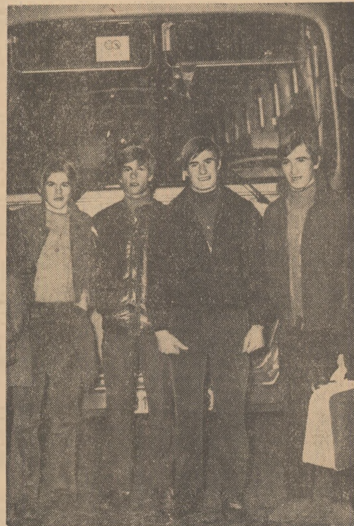
Micul grup al schiorilor francezi și austrieci în fața microbuzului cu care s-au deplasat la Poiana.