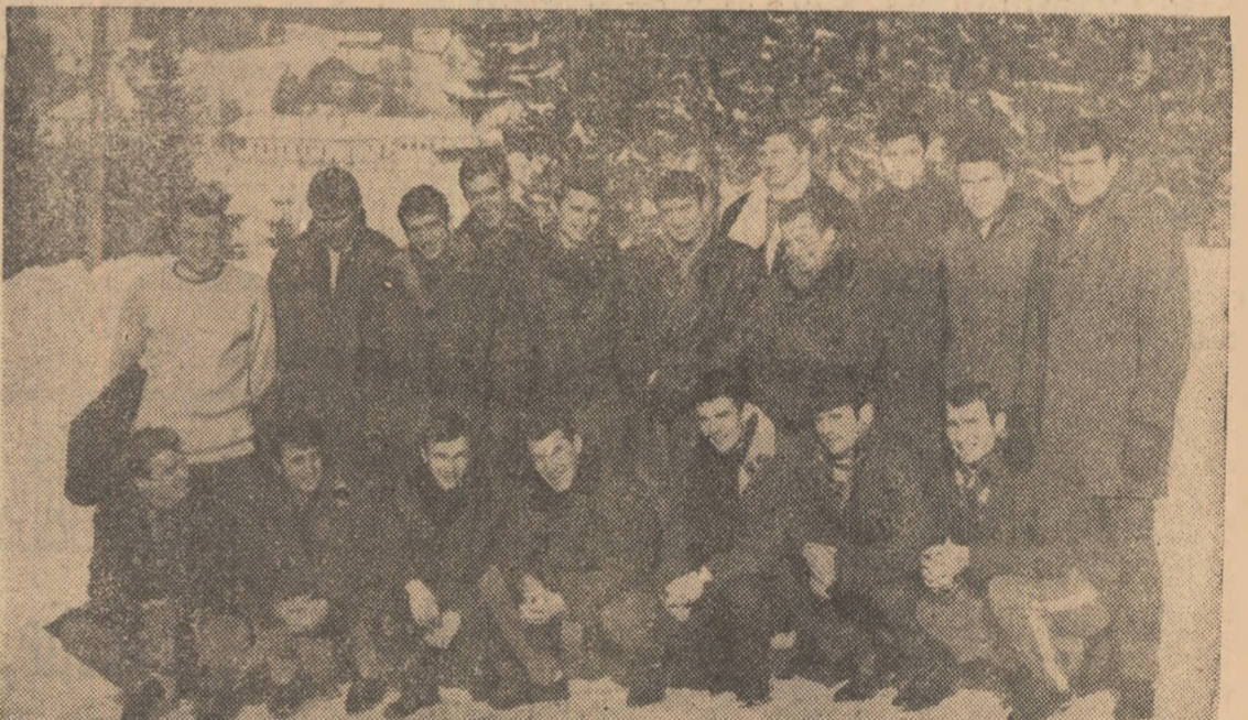
O fotografie pentru „Sportul”. Intreaga echipă de handbal a României — care la această oră se află în drum spre Paris — a pozat fotoreporterului nostru în decorul fermecător al Predealului.

În repriza secundă, incursiunile repetate spre buturile echipei Independente încep să energizeze pe jucătorii argentinieni, care joacă din ce în ce mai dur. Chiar în min. 48 Dobrin ratează de la numai 6 metri. Dar în min. 61, la o acțiune a lui