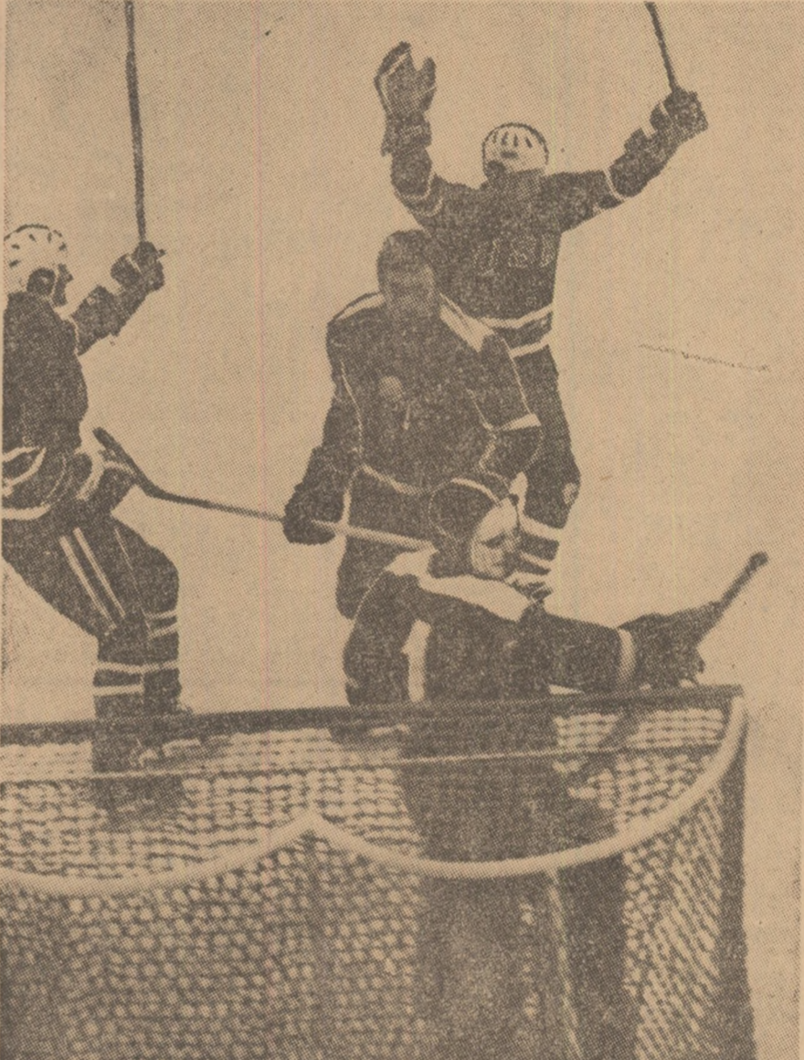
Hocheiștii S.U.A. sînt fericiți. Au marcat primul din cele 19 goluri ale victoriei.

Intîlnirea vedată de ieri a adus pe gheață două echipe de valori total diferite, ceea ce, în mod firesc, s-a reflectat în desfășurarea jocului. Hocheiștii americani și-au demonstrat clasa ridicată și în partida cu Bulgaria. Ei s-au impus net de-a lungul celor 60 de minute, timp în care au zburdat pe teren, dominînd categoric și supunîndu-și adversarii la o defensivă strictă, din care au ieșit doar de puține ori și atunci fiind parca preocupati mai mult de asigurarea propriei porți, decît de a amenința pe cea a lui Wetzel.