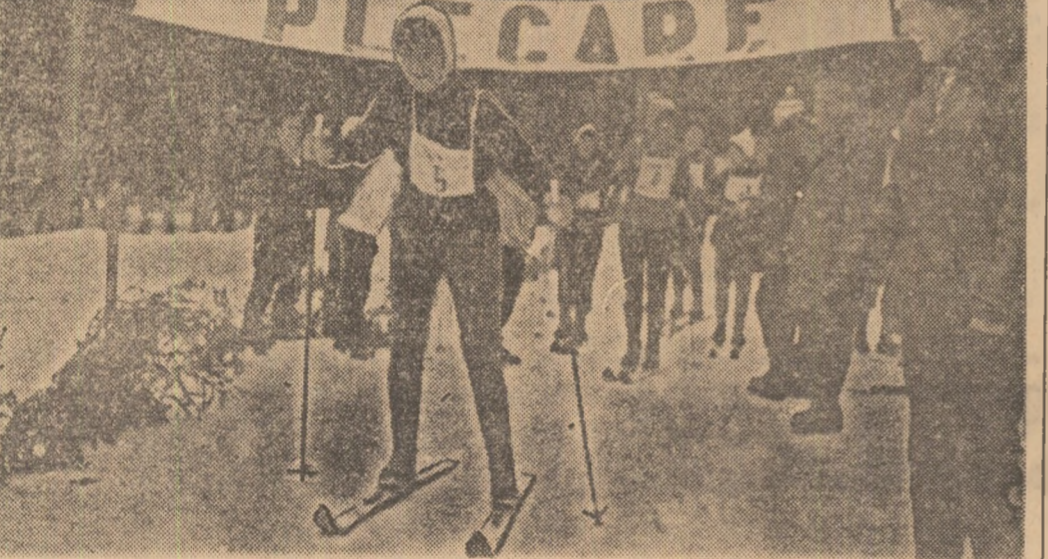
Prima — încă de la prima ediție — cu deplină satisfacție de tineretului universitar, „Cupa U.A.S.R.” la schi se află în fața fazei finale. Imaginea surprinsă, anul trecut, în timpul probei de fond, ne îndreptățește să credem că și anul acesta vom asista la întreceri pasionante dominate de exuberanța juvenilă.

Ora 17: Elveția—Norvegia Ora 19,30: Iugoslavia—România