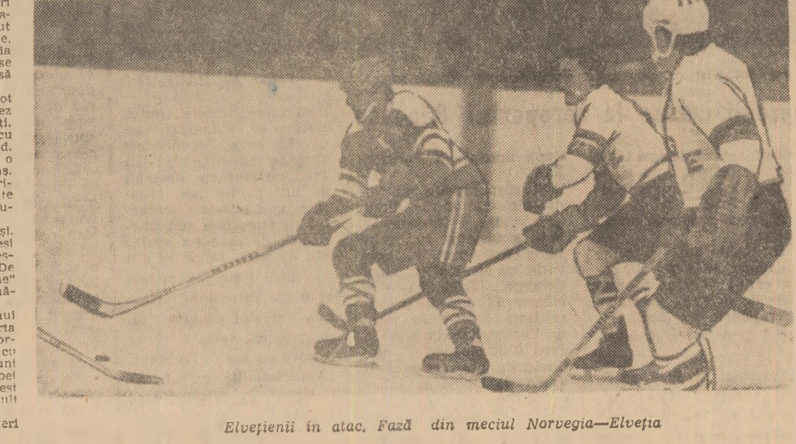
Elvețienii în atac. Fază din meciul Norvegia—Elveția