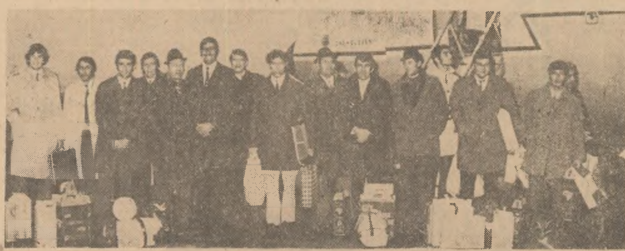
Lotul fotbalistilor nostri la puține clipe după sosire