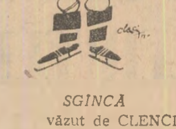
SGINCA văzut de CLENCIU

toarea, chiar în primele secunde, Szabo I aruncă pucul la mîntuirea din fund, de unde fratele său îl pasează lui Calamar, aflat în fața porții: 1-0. Riposta iugoslavilor este promptă și vehementă. În min. 23, la o bilă albă a apărării noastre, pucul ajunge la fundul Ravnik, care egalează cu un șut pornit ca din tun, de la