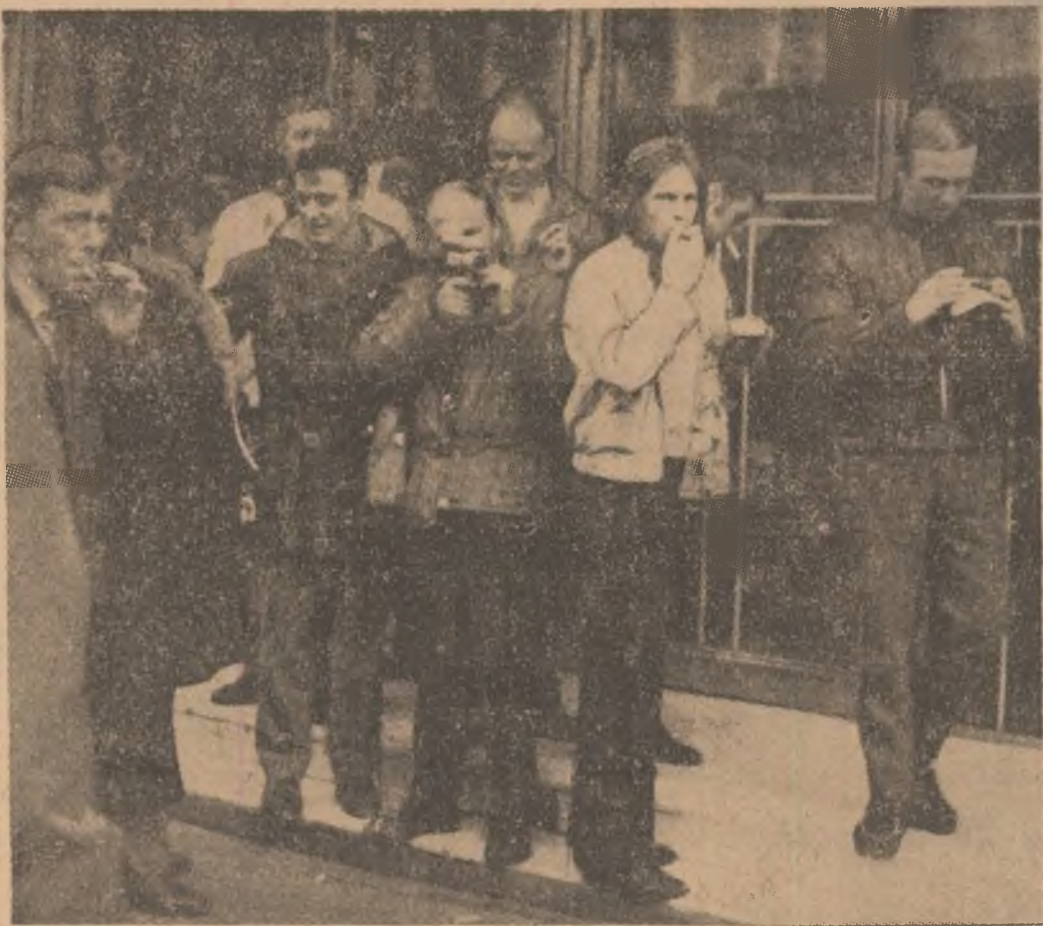
„Peste cîteva minute, hocheiștii surprinși în imagine de fotoreporterul nostru Theo Marcaschi, în fața hotelului „Ambasador”, vor lua drumul Văii Prahovei

Trebule să recunoaștem, de la bun început, că reportajul de față — care se voia o „plimbare” pe la toate echipele participante la mondialele de hochei — a fost promis încă din start, pentru că, o dată ajuns marți dimineața la hotelul Ambasador, „cartierul general” al acestui mare festival pe gheață, n-am întâlnit altceva decît priviri mirate și ridicări din umeri: — E cam tîrziu... Cu excepția elvețienilor, toate celelalte delegații și-au exprimat do-