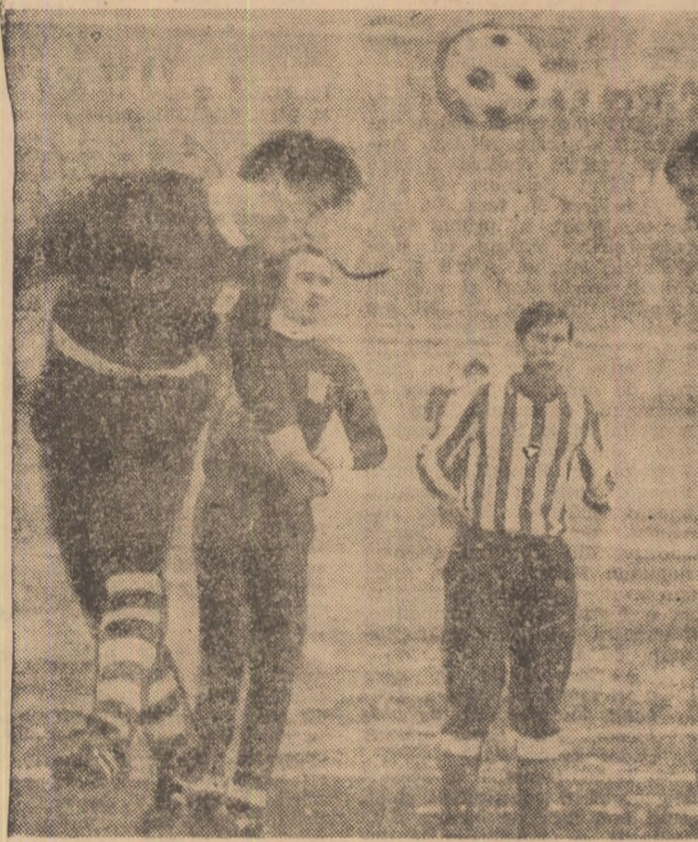
Duel aerian între Mazurachis și Prepurgel. Fază din amicalul Rapid - P.C. Argeș.