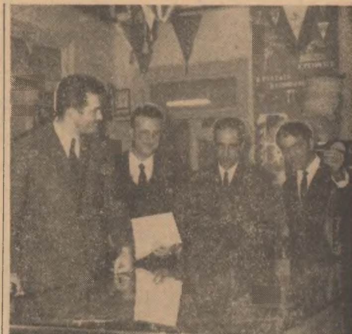
Oaspeții iugoslavi în vizită la Școala sportivă nr. 2 din București