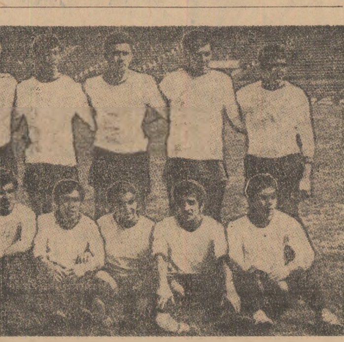
Prima dintre cele 16 competitoare ale Campionatului mondial cunoscută chiar înainte de preliminariile: Mexic, echipa țării gazdă

Walcott, 23 septembrie 1952). La 27 aprilie 1956, Marciano părăsește ringul, netivins, titlul înfrînge prin descalificare, în repriza a 4-a. Reînfrîngea dintr-un (la 21 iunie 1952), dă cușig de cauză lui SHARKEY, învingător la puncte după 15 reprize. Apoi, la 29 iunie 1953, Joe Louis, pierde titlul în fața lui PRIMO CARNERA (k.o. în rîndul 6). Următorul campion la 14 iunie 1954, este MAX BAER, care îl scoate din luptă pe Carnera, în repriza a 11-a. După un an, la 13 iunie 1955, Baer este învins la puncte, în 15 reprize de JIMMY BRADDOCK, învingătorul acestuia (k.o. în repriza a 8-a, la 22 iunie 1937) va fi JOE LOUIS, care va deține titlul de campion mondial timp de 12 ani. Pentru titlul declarat apoi vacant, EZZARD CHARLES înfrînge la puncte, după 15 reprize, pe Joe Walcott (22 iunie 1940). Dar JOE WALCOTT se revanșează, la 18 iulie 1951: k.o. în repriza a 7-a. Pe lista campionilor apare, apoi ROCKY MARCIANO (victorie prin k.o. în repriza a 13-a, asupra lui