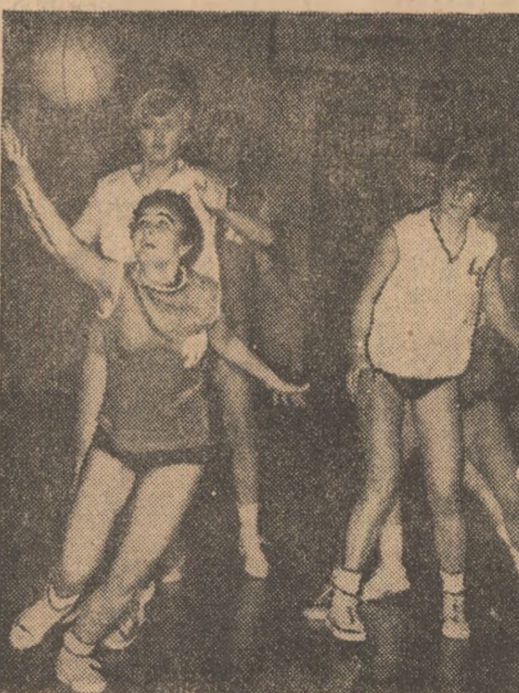
Fază din meciul Politehnica — Progresul