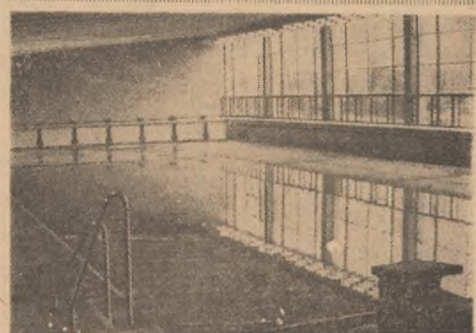
Primele jeturi de apă în noua piscină acoperită a Capitaliei. Bazinul de 50 m și 8 culoare, de la complexul sportiv „23 August”, este gata pentru a primi ca oasepeți pe înotători și jucătorii de polo.

La Belgrad a început un turneu internațional de box la care participă sportivi din România, Bulgaria și Iugoslavia. Jara noastră este reprezentată de Gruiescu și Stanef, iar Stanef pe Jivkovic (Iugoslavia). Amîndoi vor evolua în finala turneului. Ceilalți sportivi români au pierdut întîlnirile pe care le-au susținut, la puncte.