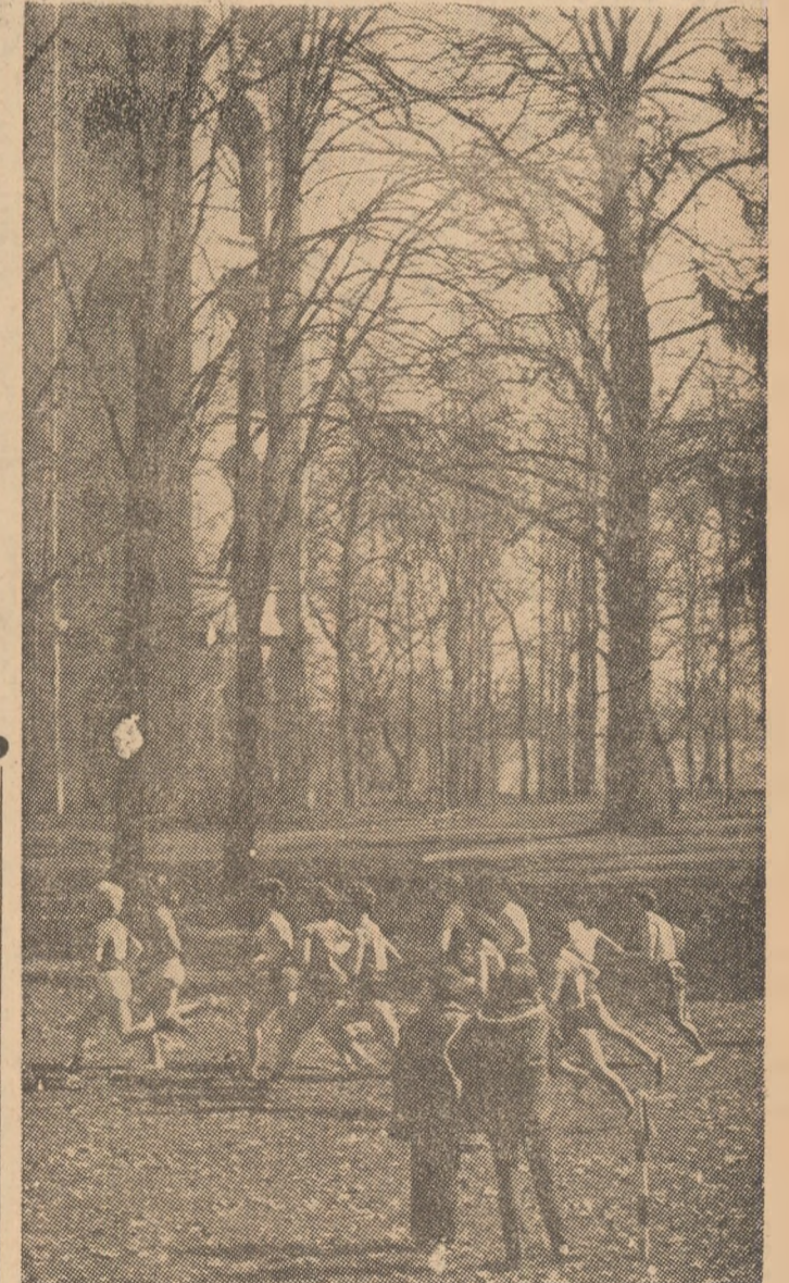
La puțin timp după start, atletele iugoslave s-au și instalat la conducerea plutonului de alergătoare senioare