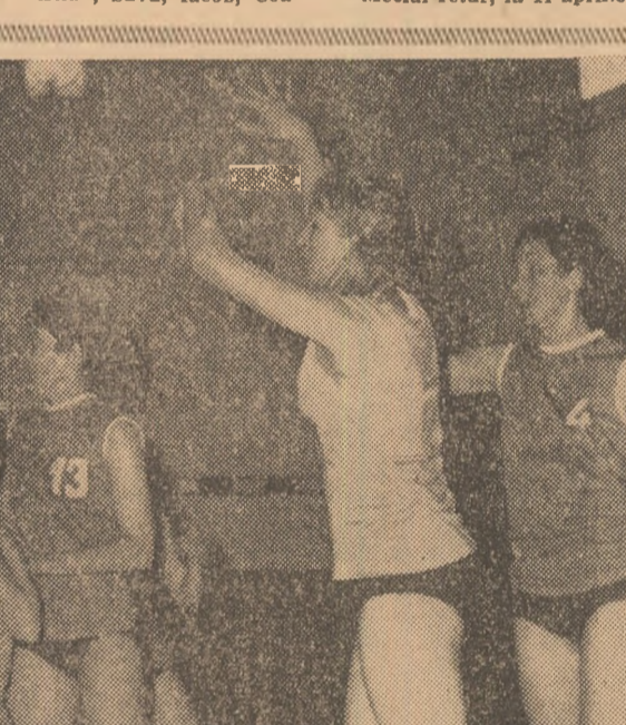
O fază greu de explicat (meciul Politehnica — Crișul): 5 jucătoare în cîdutarea balonului bucuiaș

ședință de lucru A COMISIEI CENTRALE DE MEDICINĂ SPORTIVĂ Recent a avut loc în Capitală ședința trimestrială de lucru a Comisiei Centrale de Medicină Sportivă. La lucrările comisiei a participat tov. conf. dr. Emil Ghibu — vicepreședintele al Consiliului Național pentru Educație Fizică și Sport. Cu acest prilej au fost discutate și avizate regulamentele și instrucțiunile de funcționare ale unităților rețelei de medicină sportivă.