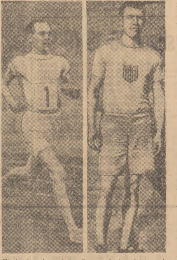
Victimele cele mai de răsunet ale ipocriziei unui „statut amator” desușit, necorespunzător epocii noastre: Jondastul Paavo Nurmi (Finlanda) și decatolnștul Jim Thorpe (S.U.A.).

Intreg studiul — cu expunerea de principii (subtitlurile aparținînd redacției), cu proiectul noului text al articolului 26 și cu propunerile noilor interpretări oficiale — a fost supus, în timp, multor foruri sportive internaționale, cu intenția de a obține opiniile cele mai autorizate. În octombrie 1969, la Dubrovnik, în reuniunea Comisiei executive C.I.O., cu Adunarea generală a Comitetelor olimpice naționale (cu fost reprezentate 69), s-a dat o înaltă apreciere lucrării, doar patru C.N.O. (Anglia, Australia, Noua Zeelandă, Portugalia) ridicînd obiecții. De curînd, în martie 1970, la München, Adunarea generală a Federațiilor sportive internaționale — supusă aceluiași test de opinie — a adoptat o rezoluție prin care „susține în principiu proiectul prezentat, considerîndu-l ca un prim pas înainte față de regulile existente”. Decizia definitivă revine sesiunii C.I.O. de la Amsterdam, în luna mai. Nădăjduim că — în ciuda unei infime minorități de detractori și conservatori — rătăciunea va triumfa.