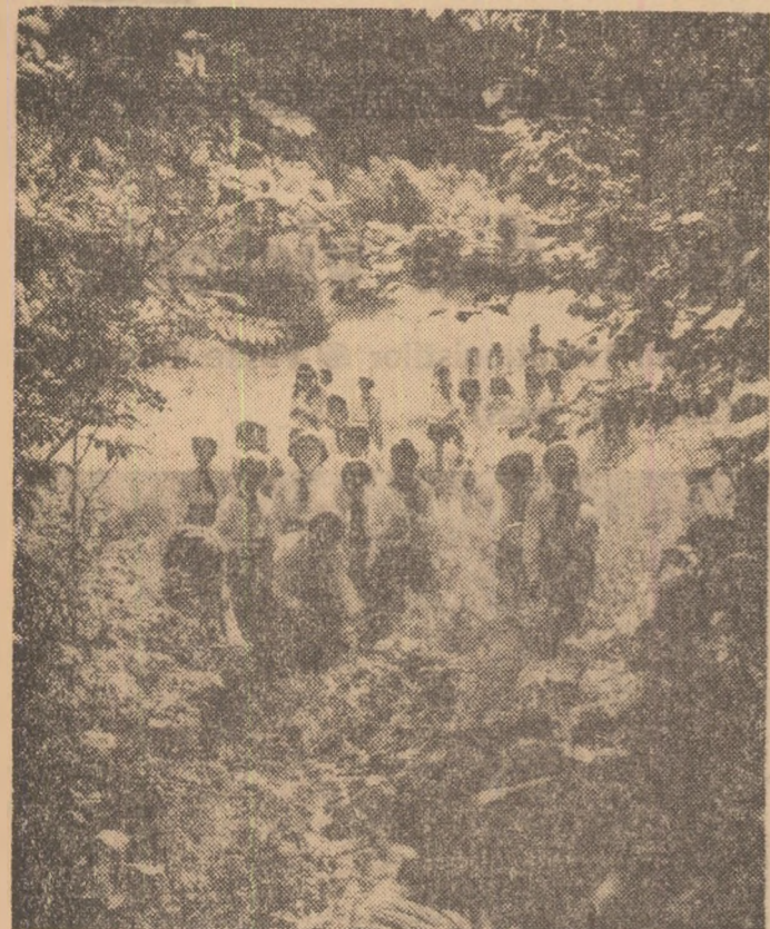
Cea mai pregnantă realitate din turismul nostru: excursiionistii cu cravate roșii în mijlocul naturii