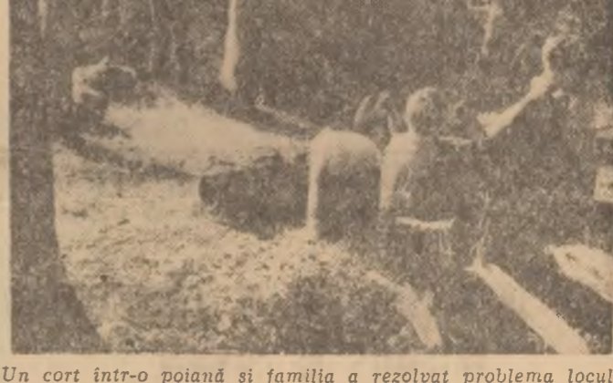
Un cort într-o poiană și familia a rezolvat problema locului de popas...

Vom organiza și în acest an tabere cu profil turistic. Am anticipat, stabilind tabăra finalizării din „Șteta icsusintei și îndemînării” la munte. Se va face și o tabără cu finalizării concursului „Roza vînturilor”. În ce privește școlarizarea președinților de cercuri turistice — copiii, vom face acest lucru în 10 tabere pe zone, reunind cam 300 copii în fiecare tabără. Deci, circa 3000 pionieri vor fi școlarizați în problemele de organizare a drumeției, a taberelor etc.