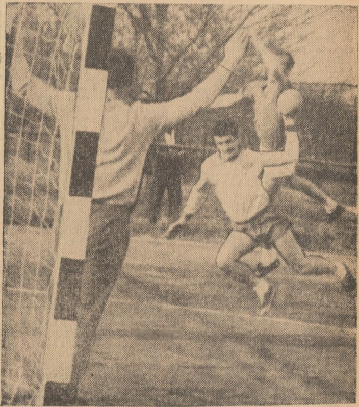
Fază din meciul Voința București — Dinamo Brașov, în care bucureștenii, mai activi în atac, au învins cu 22 la 17.

condus cu multe greșeli M. Pașec și N. Andreea (Craiova). (I. BOTOCAN — coresp.). VOINȚA ODORHEI — UNIVERSITATEA TIMIȘOARA 11—6 (6—2). Gazdele (locul 10 în clasament) și-au înscris în palmares un frumos succes, reușind să domine de-a lungul întregii partide pe campioane. Victoria handbalistelor de la Voința, pe deplin meritată, a fost realizată de Miclos (6), Magyari (2), Teglas, Marcoși și Vary.