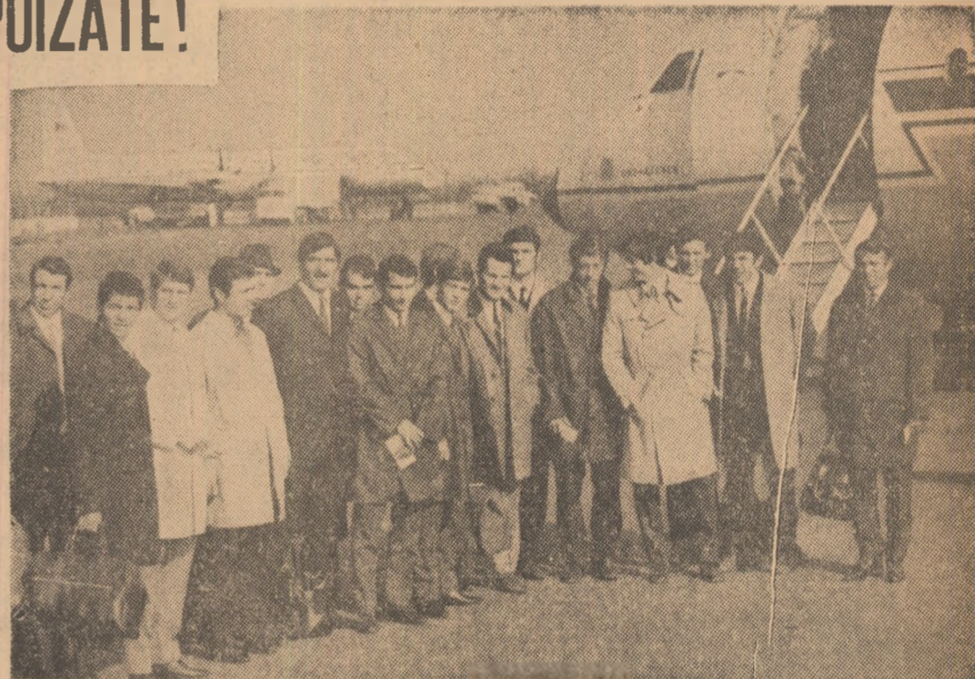
Lotul fotbalistilor pozează înainte de a pleca spre Stuttgart

● Reprezentativa României a sosit la Stuttgart luni la amiază ● Angelo Niculescu are o singură dilemă: Dumitru sau Ghergheli? ● Și totuși, Helmuth Schön a apelat la Schnellinger și Haller! ● Partida va fi transmisă, în întregime, la radio