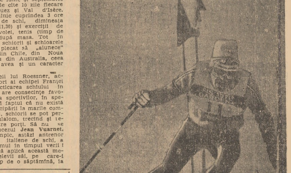
Un as al schiului francez: Jean Noël Augert