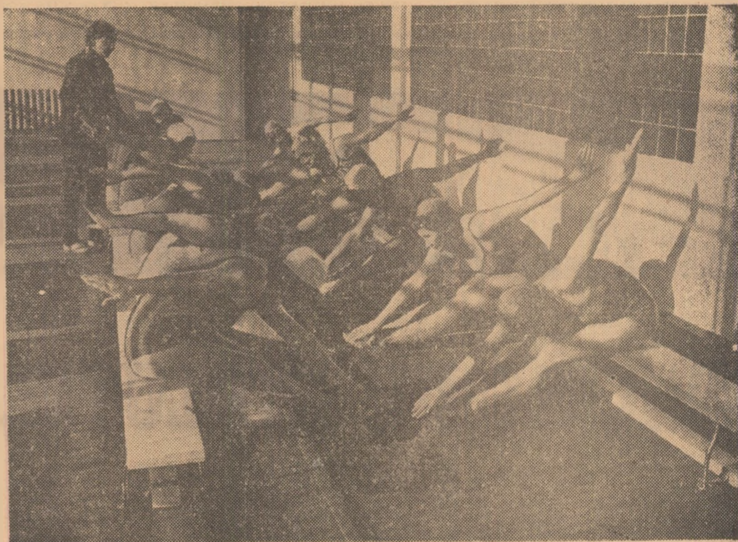
O nouă asociație sportivă, înființată în capitala Uniunii Sovietice, poartă numele sugestiv de „Sănătatea”. În cadrul ei, exercițiile fizice sînt practicate de oameni treceți mai de mult de pragul maturității, aflați în activitate sau pensionari. Iată-i pe sportivi de la „Sănătatea” făcînd exerciții de încălzire la marginea bazinului de înot.