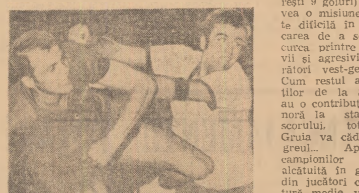
Deși evident (și grosolan) obstrucționat, Grui reusește să tragă la poartă și să înscrie în meciul tur, Steaua V.F.L. Gumpersbach. În el își pun și astăzi speranje suporterii echipei noastre campioane.

Apărarea campionilor noștri, alcătuită în general din jucători cu statură medie, va trebui să dețină mari eforturi pentru a stăvili atacurile adversarilor.