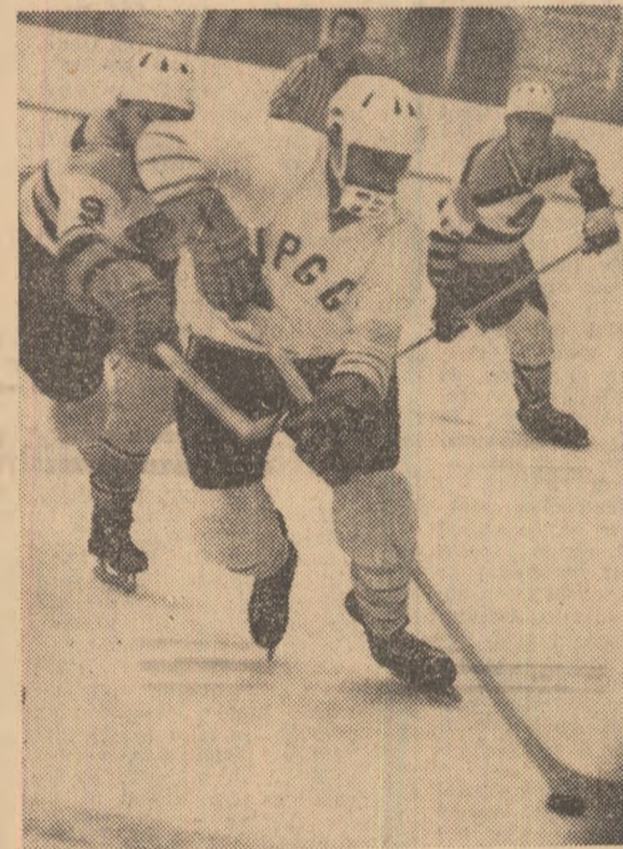
Aspect din meciul I.P.G.G.—Agronomia Cluj