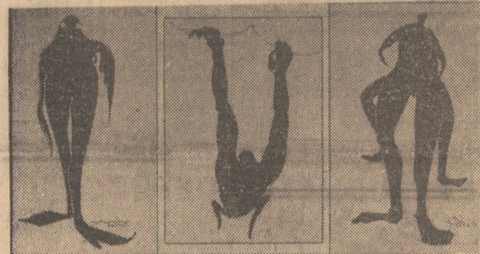
„Sportivii viitorului” — așa cum îi vede revista italiană „EPOCA”