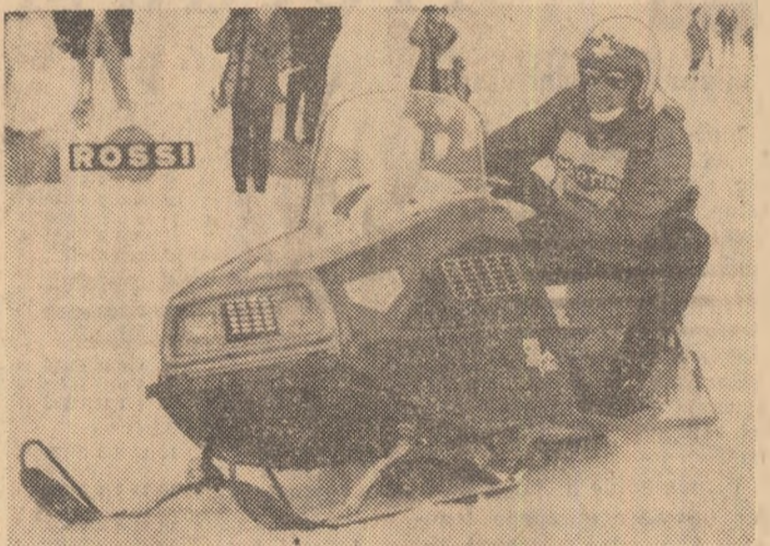
Scotera de zăpezii pregătirea sportivilor mecanice de divertisment ale viitorului. Elvețianul Clay Regazzoni (în fotografie) sugerează aspectul automobilistului iarnă de mine.

ra valorilor agonistice, „forme” atletice și capacității tehnice, condiții covârșitoare în competiții. Primordial, nu vrea să însemne însă exclusiv, unic, singular, împins pînă la refuzul oricărui alt aspect oglindit de manifestările sportive. Căci înzestrarea intelectuală și agerimea minții, factorii psi-