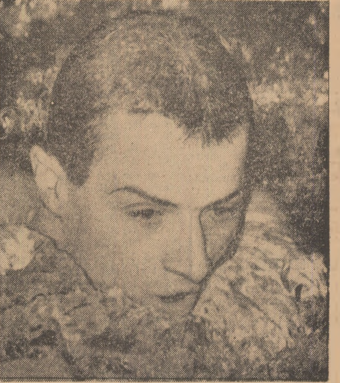
V. Costa, brasistul nr. 1 al întîlnirii.

Înotătorii români au cîștigat 14 probe din 15 Slavici — performerul întîlnirii