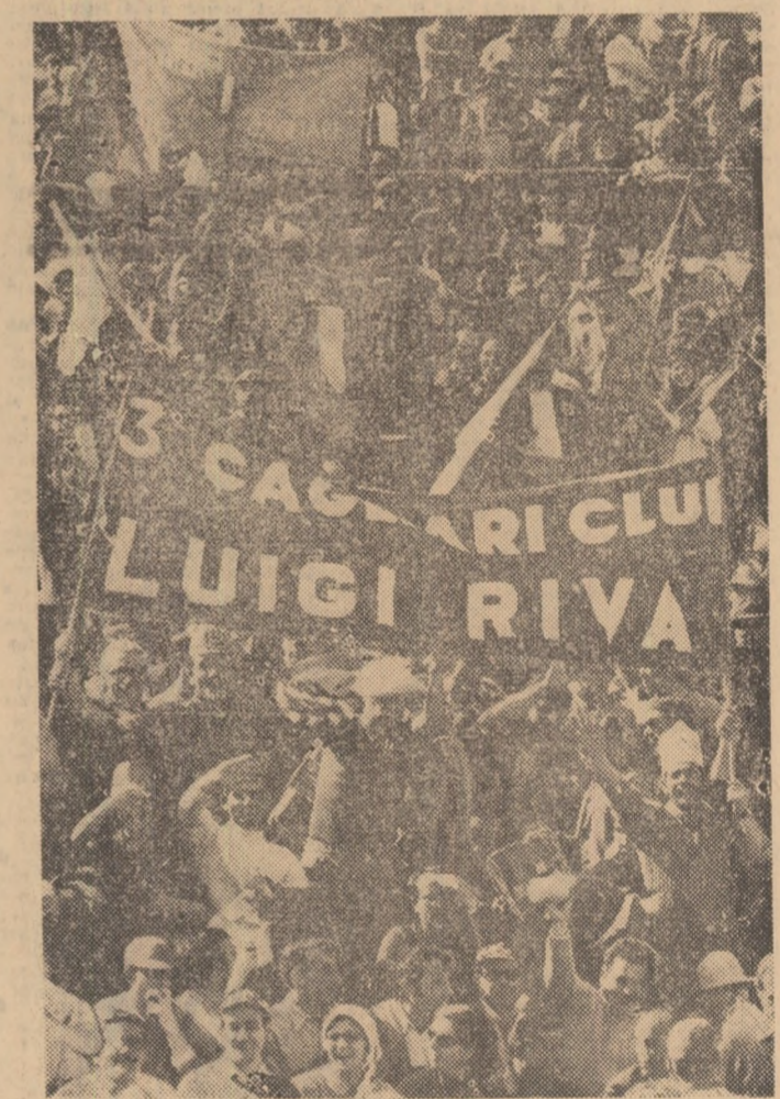
După ce U. S. Cagliari a cistigat pentru prima oară campionatul Italiei, suporterii echipei din Sardinia îi fac o primire triumfală