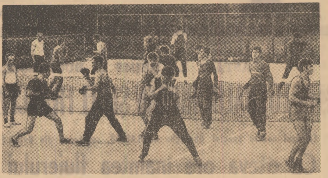
Sub privirile atente ale antrenorilor Chiriac și Sparov steliștii se pregătesc de zor pentru finala de simbioză. Box cu umbra, la mânuși, săritura la coardă...

Asadar meciul Steaua — Dinamo va pune punct campionatului republican pe echipe, din acest an. Este un derby care suscită un mare interes. Steliștii nu s-au făcut un pic special pe pregătire, în vederea ultimului asalt. Singura modificare a programului de pregătire a constat din mutarea antrenamentelor în aer liber, imediat după ce s-a hotărât ca finala să se dispute pe stadionul Republicii. Intreg lotul, alcătuit din 27 de boxeri, își desăvârșește acum pregătirea fizică în pădurea Băneasa. Iar antrenamentele specifice au loc la stadionul Ghencea. Aici, atmosfera este optimistă, boxerii și antrenorii neconștient de o eșec.