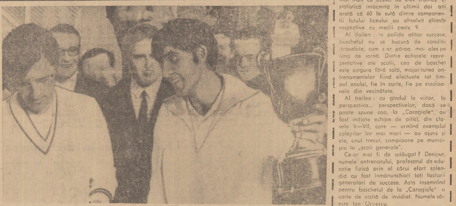
Ilie Năstase, răsplătit cu marea cupă a campionatelor internaționale de tenis ale Italiei, împreună cu învinsul său din finală, cehoslovacul Jan Kodas.