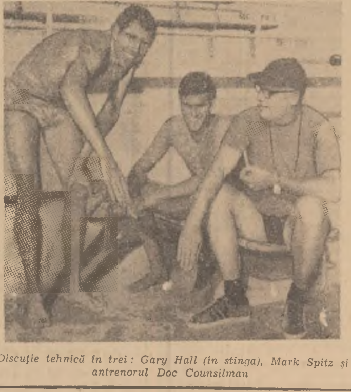
Discuție tehnică în trei: Gary Hall (în stînga), Mark Spitz și antrenorul Doc Counsilman