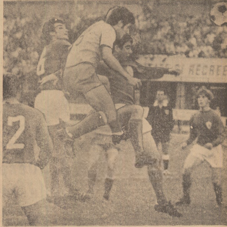
O imagine care pledează pentru atacul „orb” al românilor.

Repriza a doua a meciului este începută de echipa română cu trei schimbări: Adamache în locul lui Răducanu, Pescaru în locul lui Dumitru și Dobrin în locul lui Domide. La numai 3 minute de la reluare, Bosquier trimite un sut în bara laterală! În continuare, ritmul de joc scade progresiv, fotbalistii francezi manifestînd o anumită prudență, scorul de 2-0 mulțumindu-i, după toate aparențele. Notăm, printre altele, două frumoase lovituri de cap ale lui Revelli (min. 63) și Dinu (min. 66) și un temerar plonjon al lui Adamache în picioarele lui Revelli (min. 75). Meciul se încheie cu victoria meritată a gazdelor. Echipa noastră a jucat sub așteptări. Voi reveni cu comentarii în numărul de mîine al ziarului nostru.