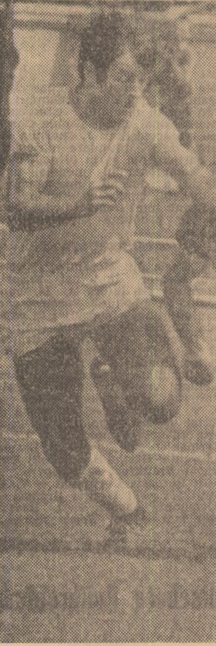
Fază din meciul Steaua - Dinamo Crețeanu (Steaua în plină cursă, se pregătește să centreze)