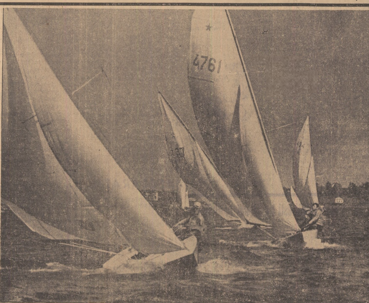
La Moscova, mercurul termometrului a urcat pînă la +27 grade, în aceste zile, egalînd un „record” meteorologic vechi de 90 de ani. Canicula prematură a oferit bucurii neașteptate iubitorilor de sport. Iată aceste pînze în bătaia vîntului, care dau lacului Himki, din apropierea capitalei sovietice, un aspect cu totul estival.