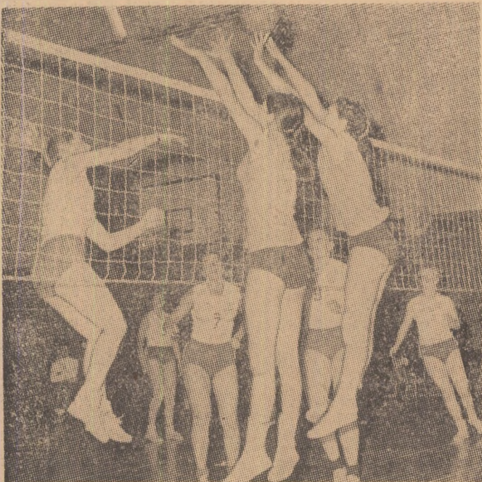
Fază din meciul feminin

Teri după-amiază, în sala Constructorilor, s-au desfășurat partidele internaționale de volei — juniori care au opus echipele feminine și masculine ale Bucureștiului și Moscovei.