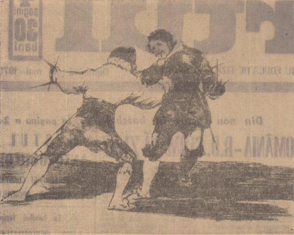
SCRIMĂ ÎN VECHIUL STIL SPANIOL