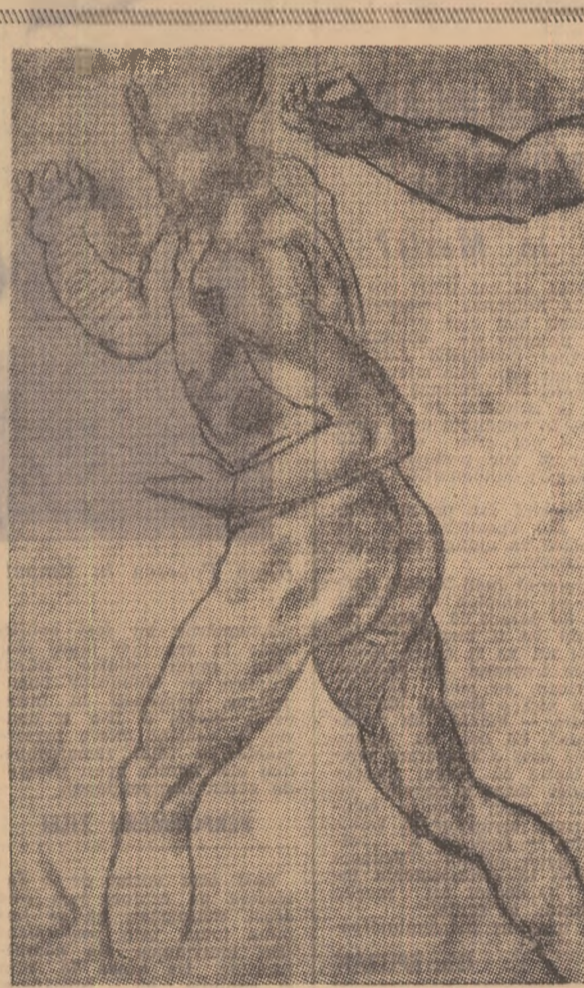
MICHELANGELO BUONARROTI (1475-1564)